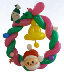
たくさんのご来場 ありがとうございました★