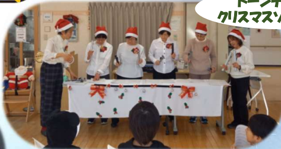
トーンチャイムで クリスマスソング演奏♪