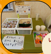
いろんな仮装グッズ と ハロウィンおかし