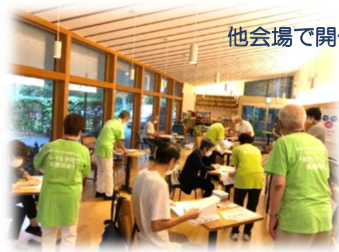
他会場で開催時の様子