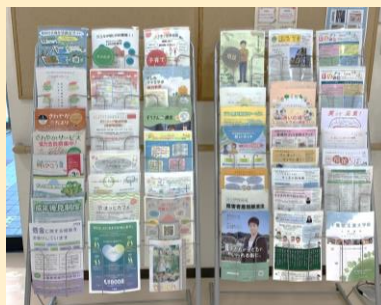
〔情報提供コーナー〕