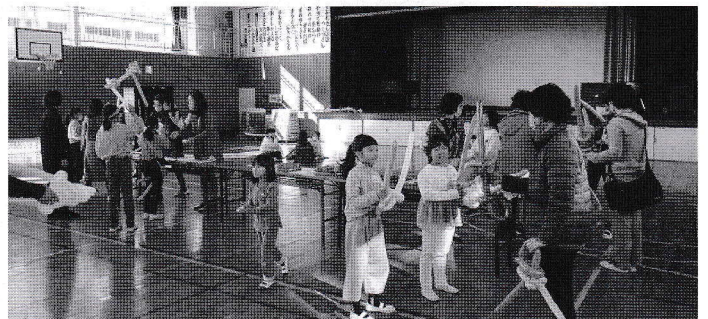
割れないかな? 大丈夫?