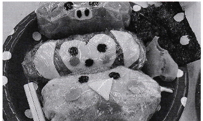
動物たちがこちらを見ている!