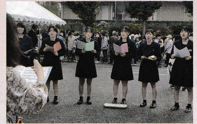
恒例、柏南高校合唱部のアカペラ。歌声にいやされます(文化祭)