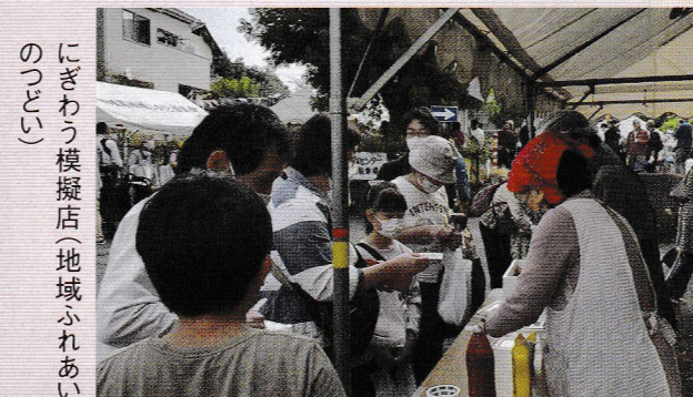
にぎわう模擬店(地域ふれあいのつどい)