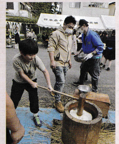
4年ぶりのお餅つき。気を入れてベッタンコ(地域ふれあいのつどい)