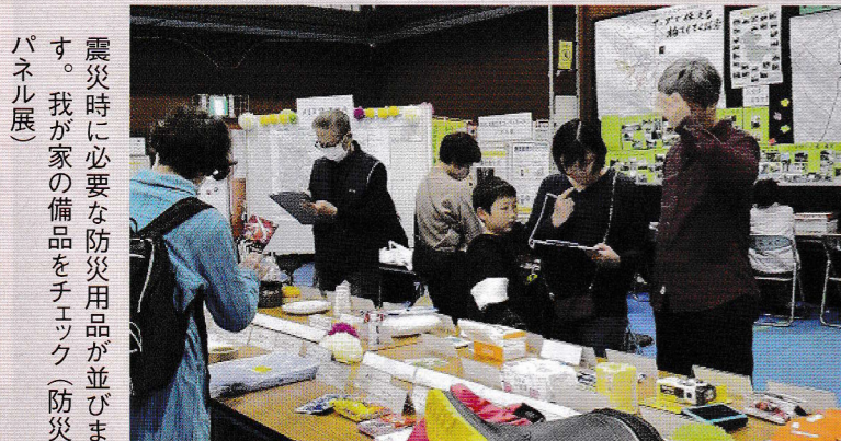
震災時に必要な防災用品が並びます。我が家の備品をチェック(防災パネル展)