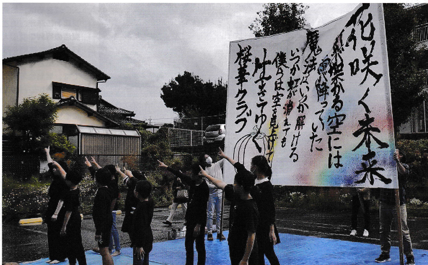
桜華クラブの力強い書道パフォーマンス(文化祭)