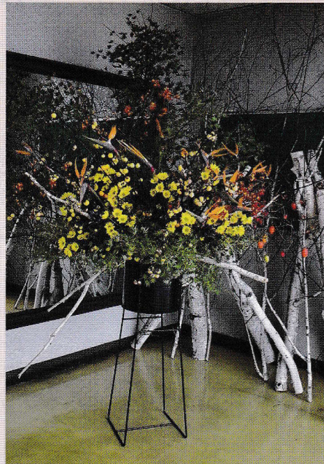
会場に彩りを添えてくれる生け花。今年も来場者を華やかに迎えてくれました(文化祭)