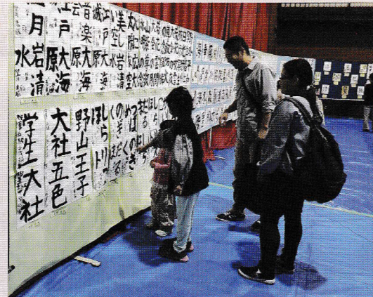
「上手に書けてるね」体育室の展示作品は力作揃い(文化祭)

2023年10月28日(土)に「地域ふれあいのつどい」、10月28日(土)・29日(日)に「文化祭」「防災パネル展」を開催しました。会場の増尾近隣センターは、展示された力作揃いの作品を鑑賞する人、焼きそば、お餅、おでん、焼き鳥、フランクフルト、豚汁、焼きおにぎり、コーヒーなどの模擬店の行列に並ぶ人、ゲームコーナーで歓声を上げゲームに挑戦する子どもたちでにぎわいました。