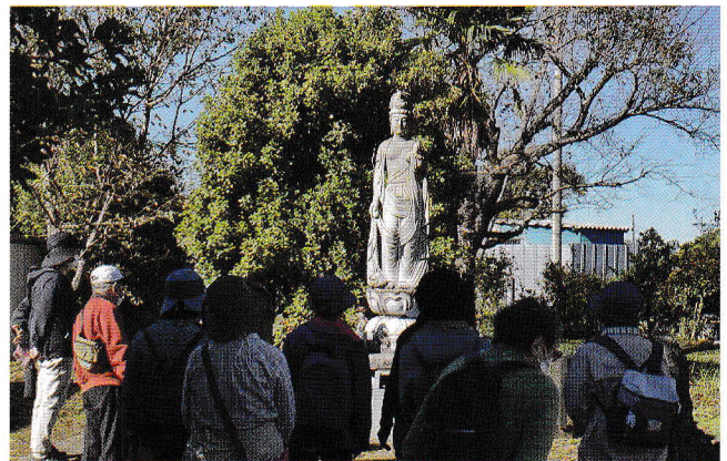
鷺の山観音像前にて