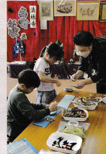
どんな目と口を選ぼうかな。鬼のお面作り教室です(文化祭)

昨年度から同時開催している「防災パネル展」では、増尾地域内の5か所の避難所色分けマップに301名がシールを貼り、自分が利用する避難所の確認をしました。防災グッズの紙芝居、非常時に必要とされる防災用品の展示にも関心を持っていただきました。