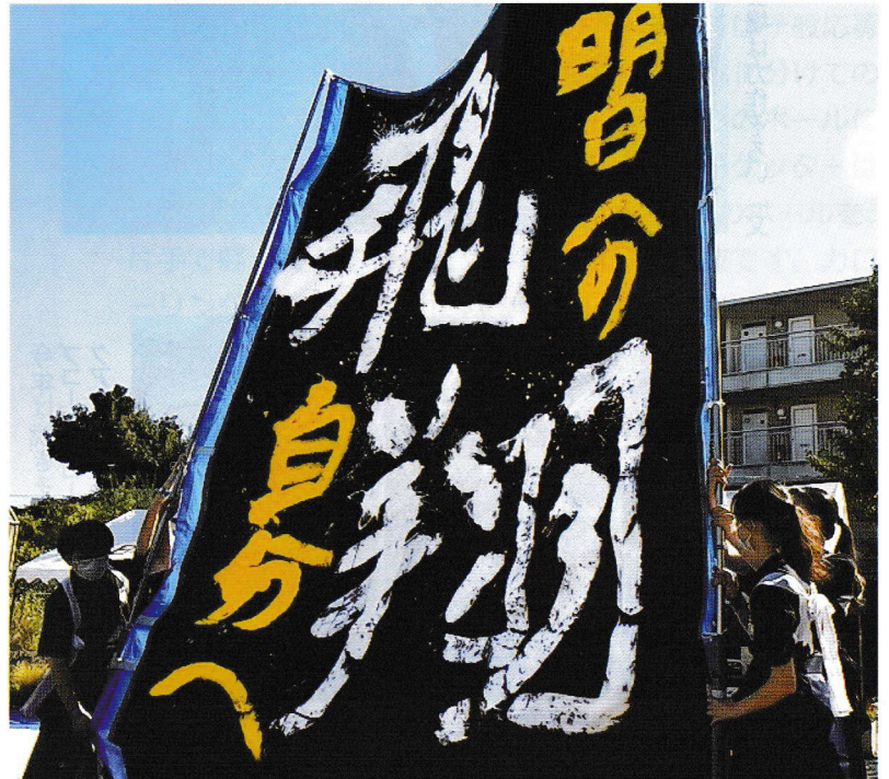
柏南高校書道部の書道パフォーマンスの作品

方が日頃の腕を奮う力作の展示がありました。初めて実施した防犯防災部の「防災パネル展」では、シールを貼って自分の避難所の確認をし、紙芝居を通して防災知識を学び、展示された防災用品を見て「わが家も準備しなければ」と意識を高める参加者が見られました。