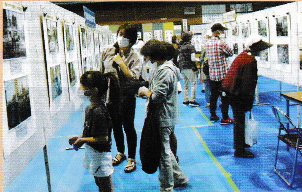
文化祭 体育室展示会場は力作ぞろい (文)

2022年10月29日(土)に「地域ふれあいのつどい」、10月29日(土)・30日(日)に「文化祭」「防災パネル展」が増尾近隣センターにおいて開催されました。待望の開催に多数の方が訪れました。