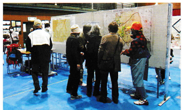
シールを貼って避難場所を確認