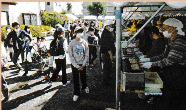
今年は焼きそば、焼き鳥、ポツブコーン、コーヒ、すべてテイクアウト(地域ふれあいのつどい)

2022年10月29日(土)に「地域ふれあいのつどい」、10月29日(土)・30日(日)に「文化祭」「防災パネル展」が増尾近隣センターにおいて開催されました。待望の開催に多数の方が訪れました。