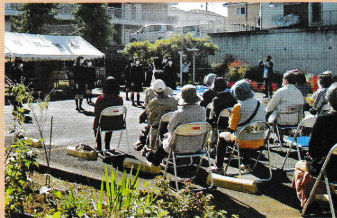
柏南高校合唱部のアカベラに耳を傾けて(文化祭)