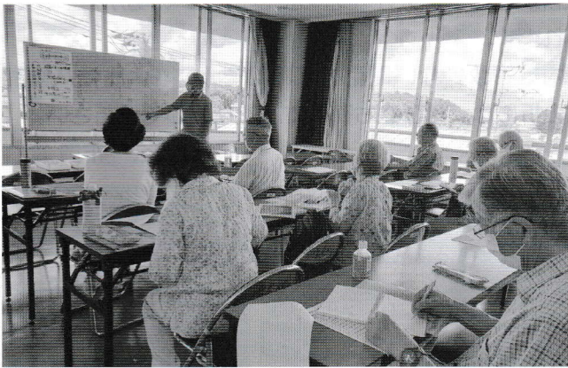
句の講評を熱心に聞き入る参加者

シュレス」です。参加者は3句ほど作り提出します。その中から選者が10句程度を選び出し、翌月、参加者がよいと思う句を互選します。1つのお題でも思いはそれぞれ。「そうそう、その気持ちよく分かる」という句もあれば、斬新な句もあり、毎回楽しみです。例えば、「底」がお題の時は、「どん底で生きた経験母に謝意」「菓子折りの底の小判が口を利き」は同票でした。また、「力」がお題の時は、「幸せは自分の力でつかむもの」「孫パワー嵐のごとく去っていく」「素顔見て化粧の力知らされる」など、十人十色です。