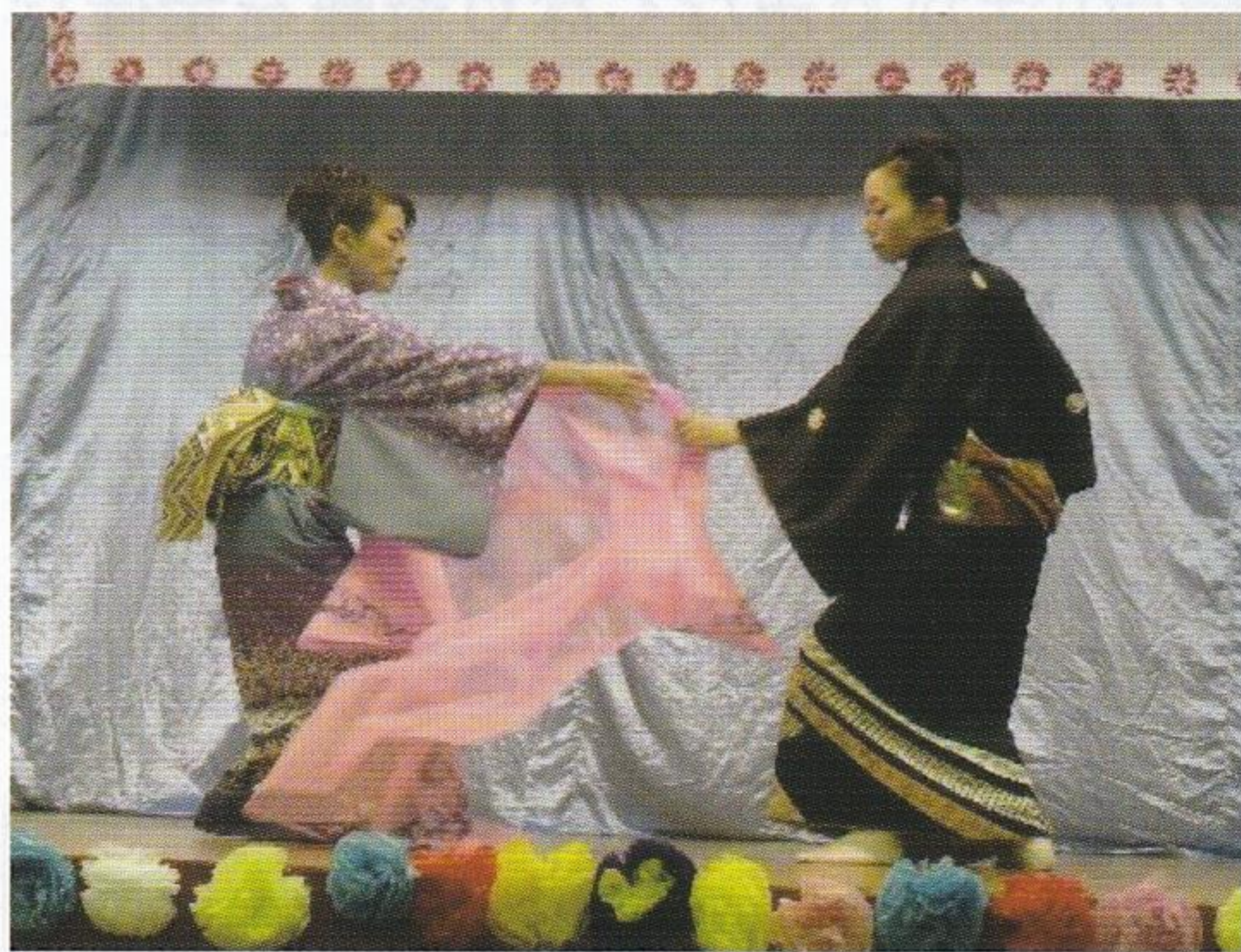
言葉はいらない あ・うんの演技