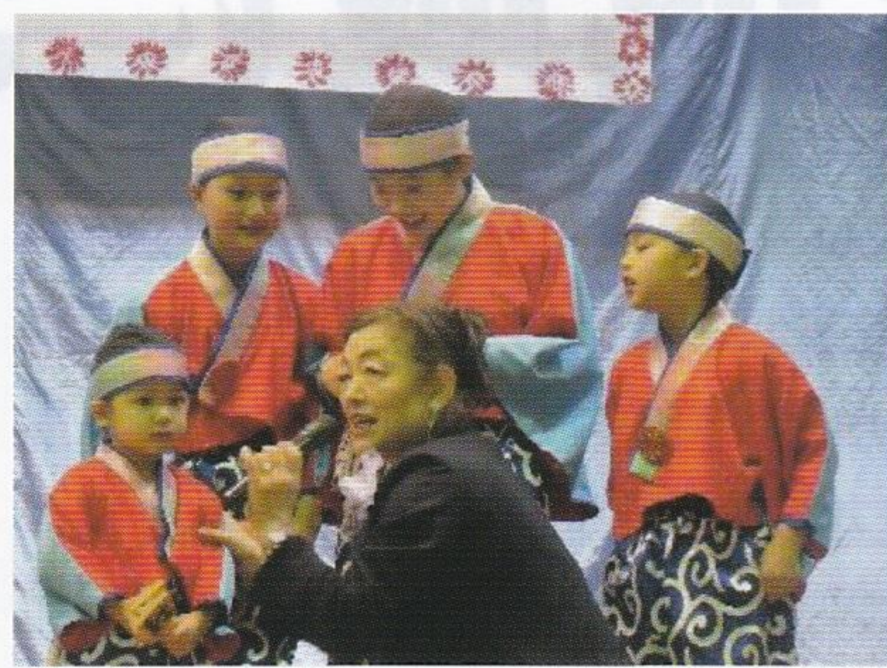
お兄ちゃんたちがいるのに僕にインタビュー？