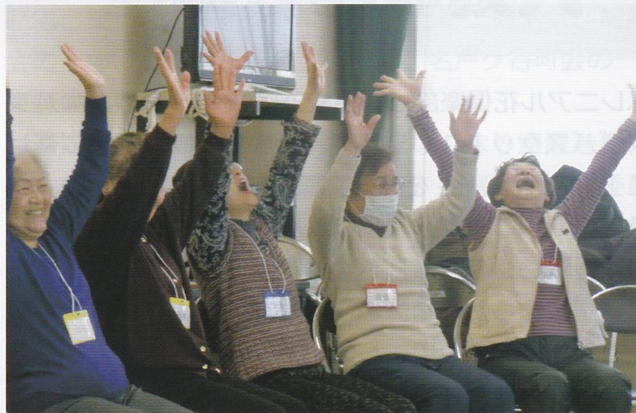
笑うってすごいパワーなのね

講座後には、地区社協部スタッフの手作り弁当とチーム対抗のゲームを楽しみました。 総務広報部