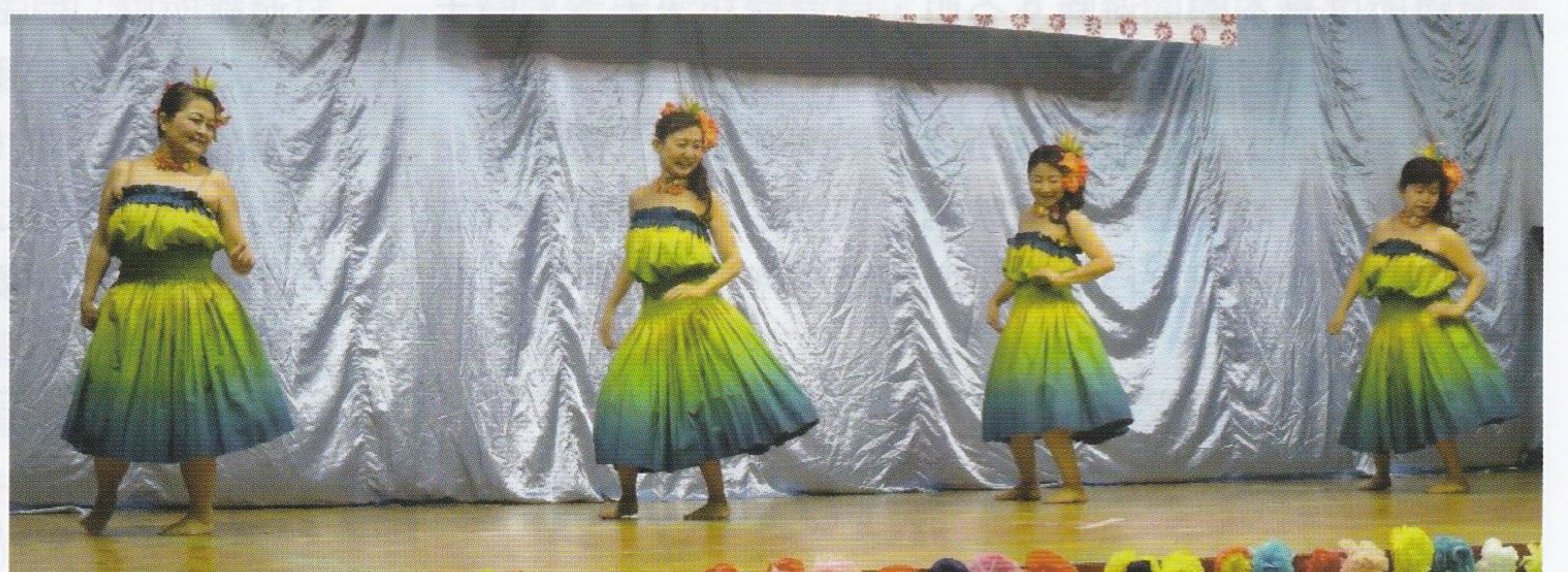
ステージは常夏のハワイ気分、すてきな笑顔で衣装もバッチリ