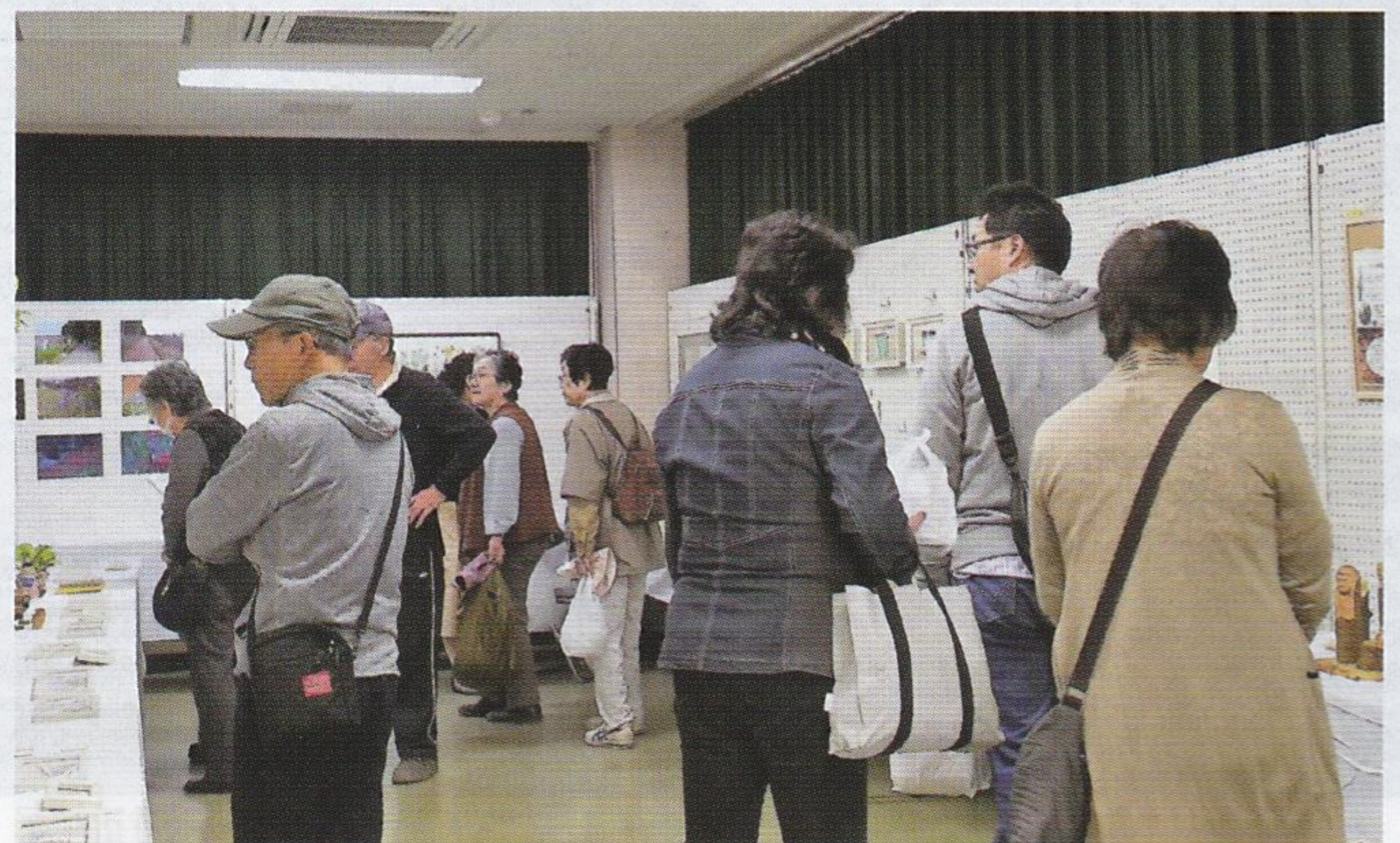
まなざしの先には