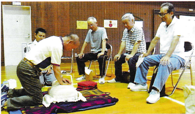
大事な胸骨圧迫を習得します