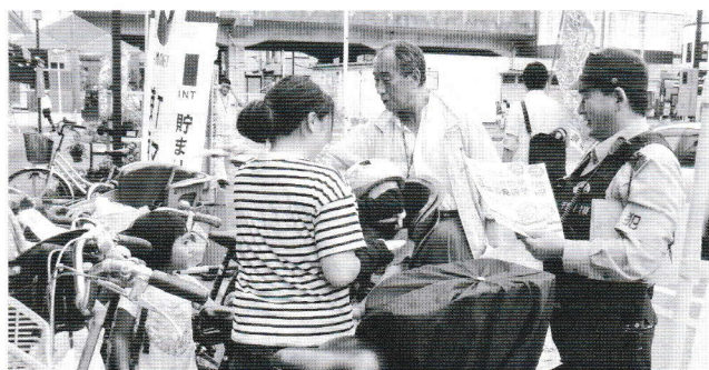
自転車は必ず鍵をかけて！