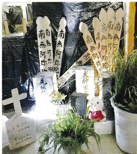
リアルな墓場が不気味です

8月5日(土)土小学校で、多世代交流コミュニティ「サロンつちのこ」が夏祭りを開催しました。体育館では吹き矢やストラックアウト、校庭では竹筒水鉄砲遊びやヨーヨー釣りなど。暑さも何のその、子どもばかりか大人までもが遊びに熱中していました。