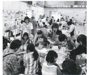
作品作りにみんな一生懸命