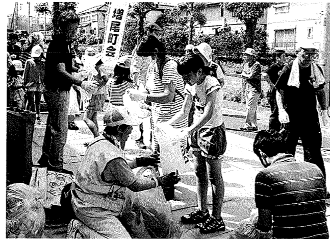
近隣センターにごみを持ち込む小学生