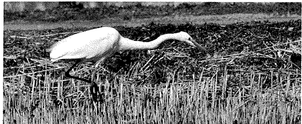
獲物を狙うダイサギ

ダイサギは環境省の保護種に指定されていて数は少ないが、増尾城址公園の水辺、大津川、名戸ヶ谷ビオトープなどで観察することができる。