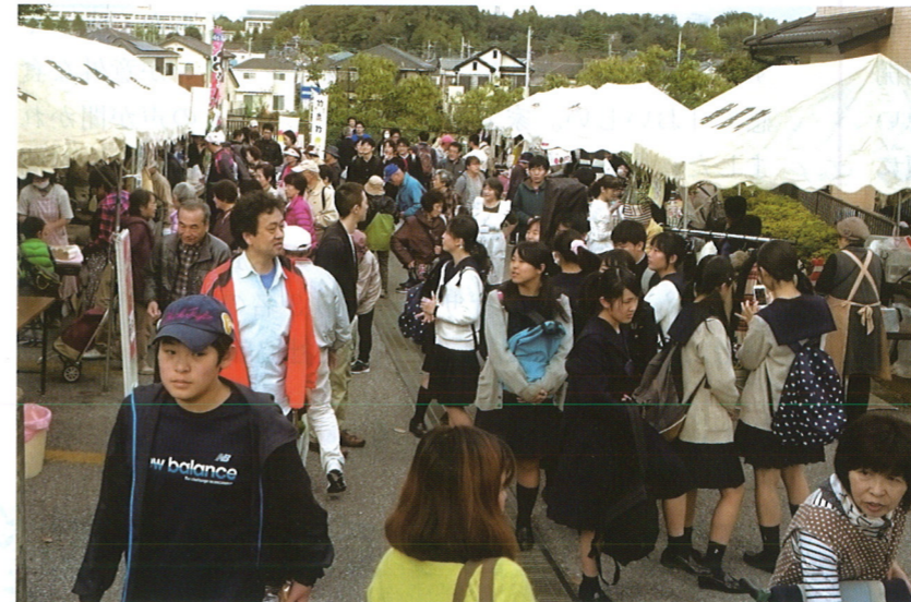
子どもからお年寄りまで超満員の会場

では、パターゴルフや的当てなどゲームの種類を例年より増やしました。その結果、たくさんの方が談笑する光景が会場のあちこちで見かけられ、「地域ふれあい」の名称にいつそうふさわしい催しになりました。