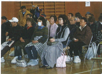
避難所の運営は誰がするの？