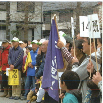
434名の人で公園が一杯に