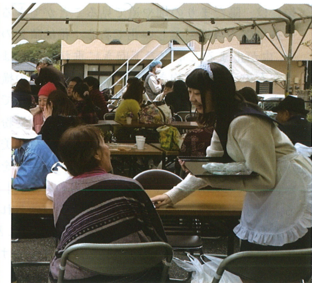
休憩コーナーではかわいい高校生がおもてなし