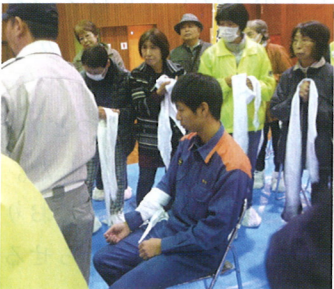
三角巾の使い方を学びます

東部消防署光ヶ丘分署隊員によりAED取り扱い、三角巾の使い方や簡易トイレの組み立て方の訓練