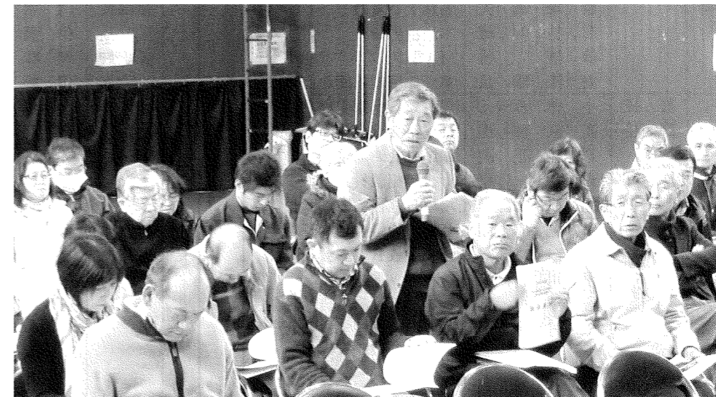
質疑応答では貴重な意見が出ました

平成25年度増尾地域ふるさと協議会総会を4月21日、増尾近隣センター体育室において開催し、平成24年度事業報告・収支決算・監査報告および平成25年度事業計画・収支予算が承認されました。