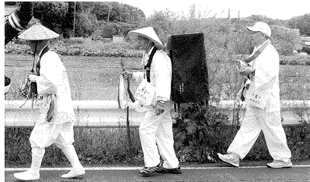
巡拝初日。萬福寺を出発

文化5(1808)年から205年続く伝統行事『東葛印幡送り大師』が平成25年5月1日～5日に行われ、約700人が参加しました。