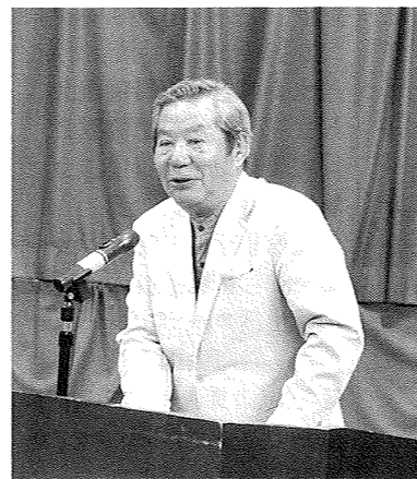
今年度の抱負を語る幸喜会長