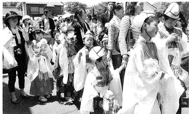
晴れがましい表情のお稚児さん立派に役目を果たしました