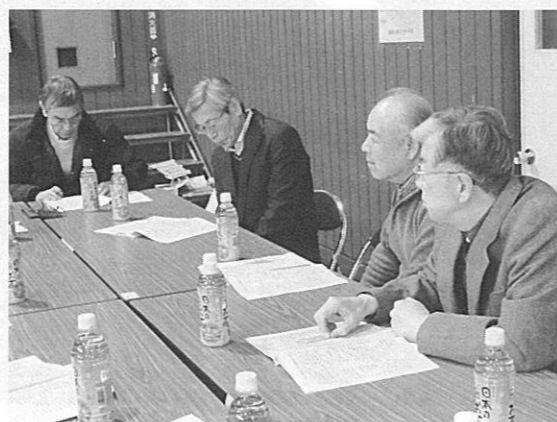
総会后、さっそく部会で打ち合わせ