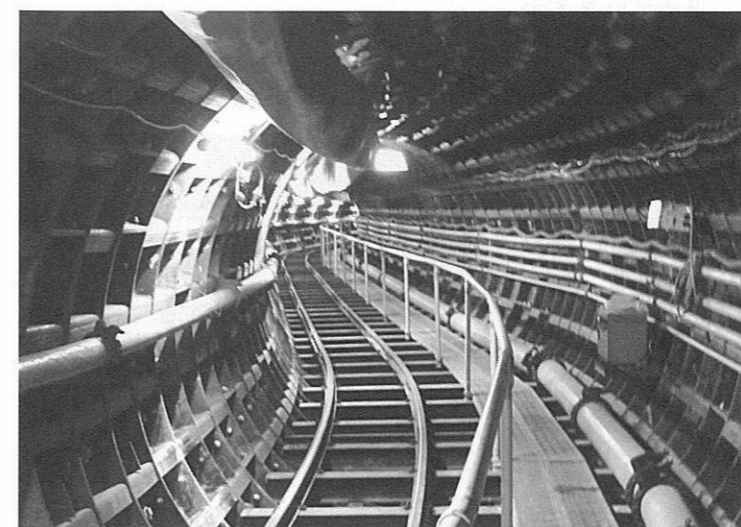
神秘的なトンネル内。ここに内径2600ミリの管が入ります