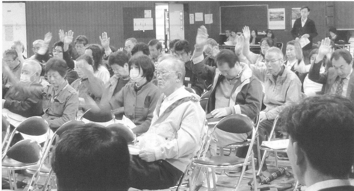
熱心に議案を協議します

あいにくの雨となった4月22日、増尾近隣センター体育室において平成24年度増尾地域ふるさと協議会総会を開催しました。