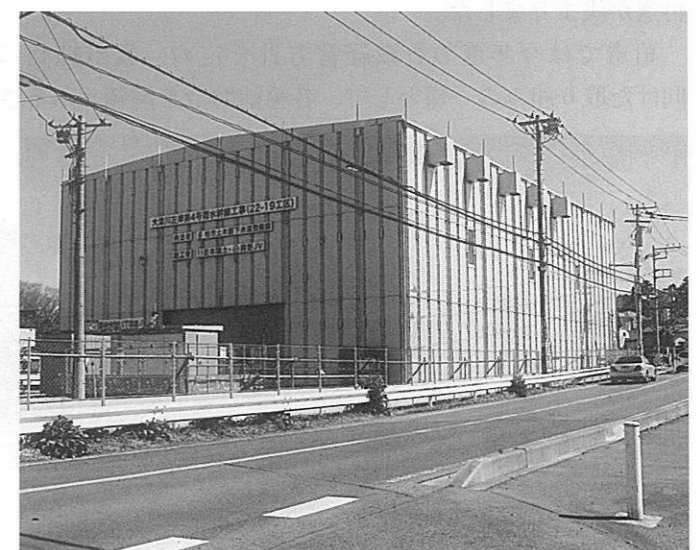
少林寺前の巨大建築物は発進立坑部防音ハウス