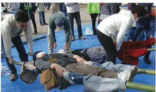
身近な物で即席の担架に (担架作製訓練)