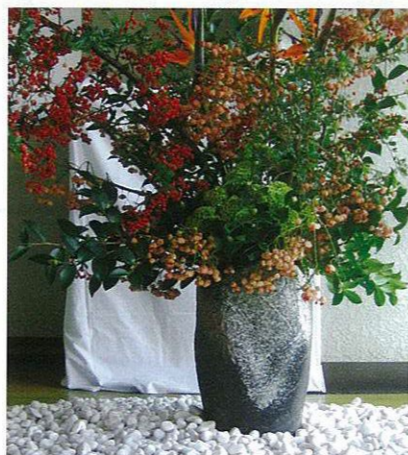
エントランスを彩る 草月流憲芳会の大作