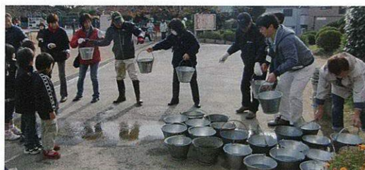
ハイ！次 (バケツリレー訓練)