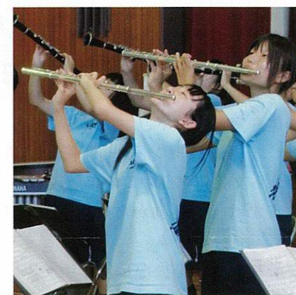
柏南吹奏楽部の力強いパフォーマンス