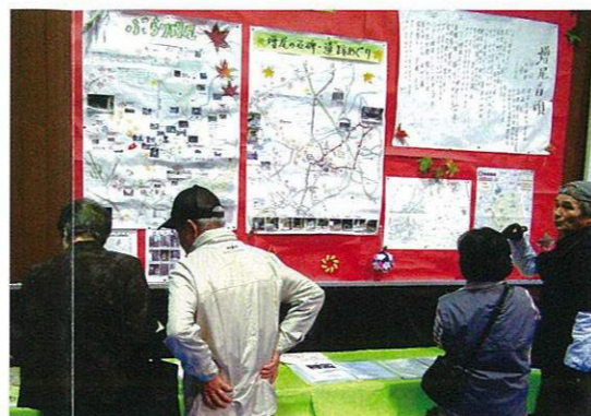
増尾探検隊は地域の文化・歴史を再発見