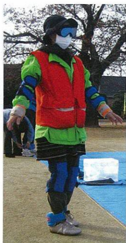
高齢者が避難することの難しさを実感 (要援護者体験訓練)