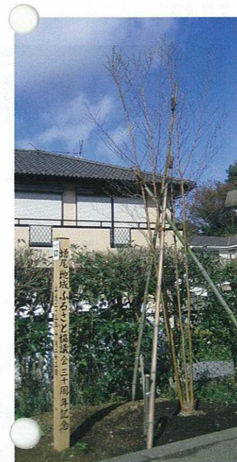
大空に向かいスックと立つ記念樹「ナツツバキ」の若木

平成24年は、そのための新しい歩みを踏み出す年です。皆さんとともに力強く進んでいきたいと思ひます。