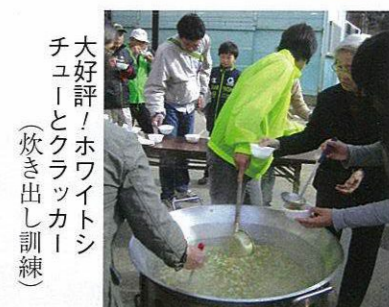
大好評！ホワイトシチューとクラッカー (炊き出し訓練)