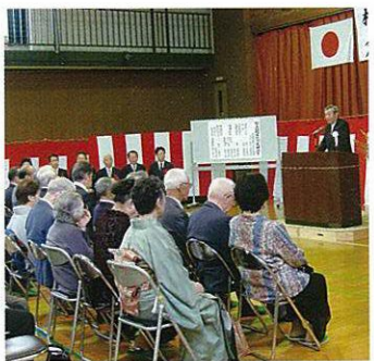
式典の会長あいさつ