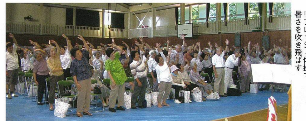
リフレッシュ体操で 暑さを吹き飛ばす