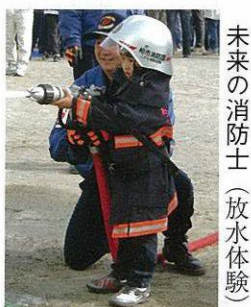
未来の消防士 (放水体験)