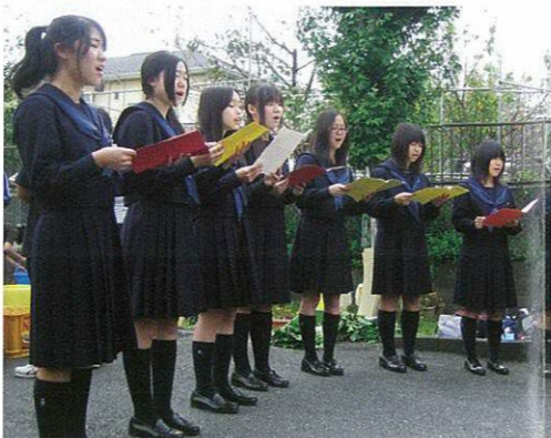
柏南合唱部のアカペラが響く