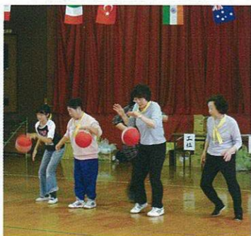
ハイ、次の人お願いネ