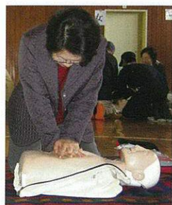
わたしにも出来た (AED取扱訓練)