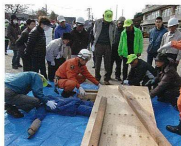
枕木位置確認ヨシ！ (がれき救出訓練)