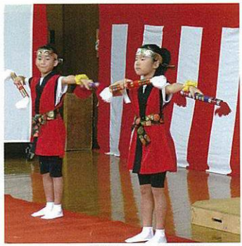
宴席の余興として見事な踊りを披露する小学生