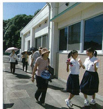
土中学校生徒がエスコート

昨年度に続いて土中学校をお借りしての開催でしたが、近隣センター体育室より広々としてゆったり過ごしていただきました。