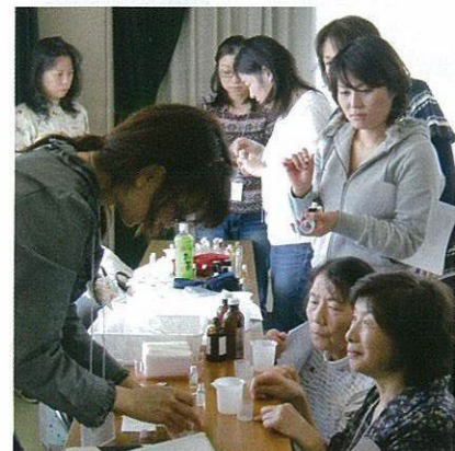
熱心に聞き入る受講生

受講生の年齢層は30代から70代と幅広く、皆さん真剣そのもの。部屋いっぱいの香りの中、アロマの歴史、メカニズムなどを学習し、最終日には“私だけの香水”を作りました。ご家族の感想はいかがだったのでしょうか。