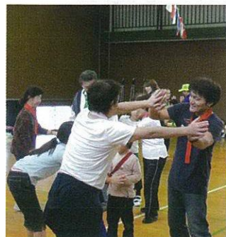
優しくストレッチ