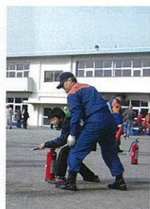
火元に向かって放射 (消火器取扱訓練)