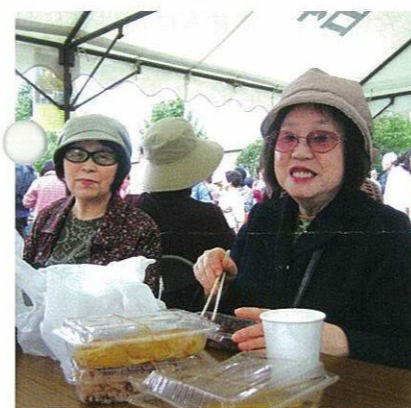
▲「ここですぐいただくのが最高」 ▼美味！コーヒー無料サービス