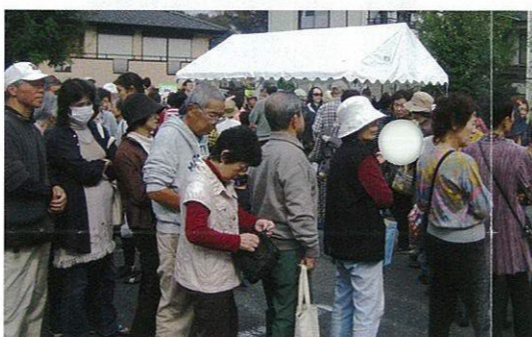
恒例になった行列。おもち、おでん、焼きそば 計2300パック完売！