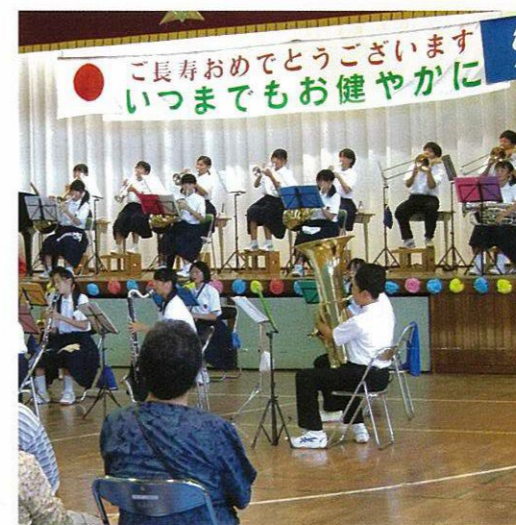
心に響く音色の土中吹奏楽部