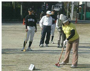
ナイスショット打ちまーす