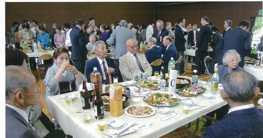
式典後のなごやかな祝宴