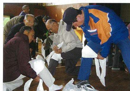
いろいろな巻き方で対処 (三角布取扱訓練)