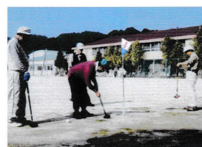
慎重に、慎重に、息を止めて