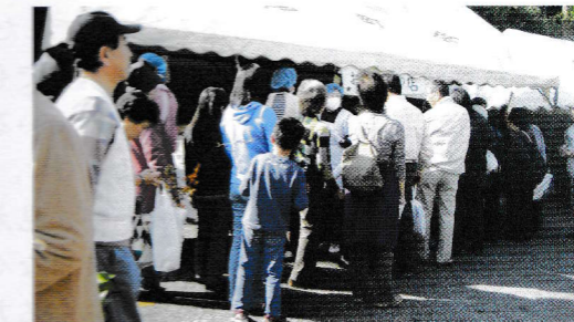
まだ? 人気のコーナーは長蛇の列