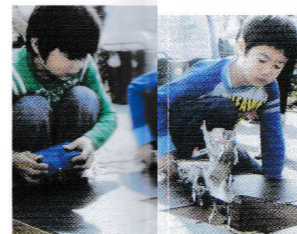
ロボットが大人気