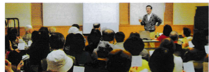
頭、頭、頭……びっしりの聴衆。メモ取りも熱心に