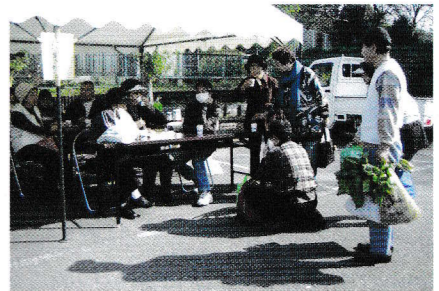
野菜買って、焼きそば食べて、満足満足