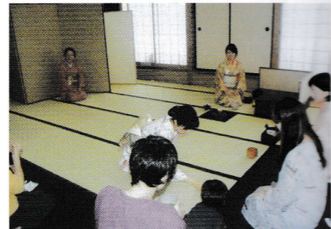
2階和室にはお茶室コーナーが

多数の自信作が出品され、来会者の目を魅了しました。また、ここここで出展者と来会者の会話が弾んでいました。