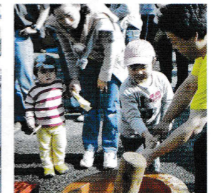
お兄ちゃんガンバレ!!