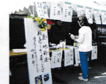
この竹酢液の使い方は?

お兄ちゃんと一緒に、重い杵をヨッコラショ! 見守るお母さんも満面の笑み。開会が待ちきれず、各コーナーには長蛇の列。休憩所では、やっと買った品を、早速ほおぼる場面も。ときは平成21年11月7日(土)、ところは増尾近隣センター駐車場。