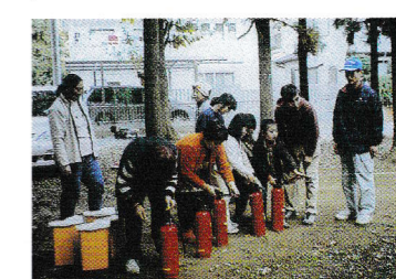
食べた後は消火器の使い方