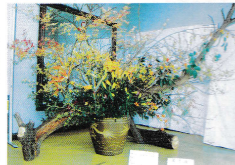
迫力さえ感じる憲芳華道教室の生け花