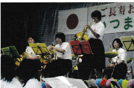
楽器の紹介、これなんでしょう?