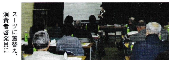
スーツに着替え、消費者啓発員に