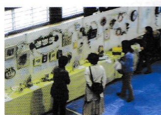
見事な手芸作品です