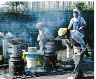
そっちのお釜、大丈夫?