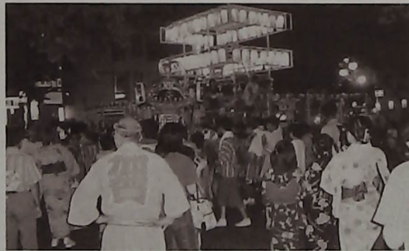
△お神輿が駅前ロータリーに到着し見物する人、人