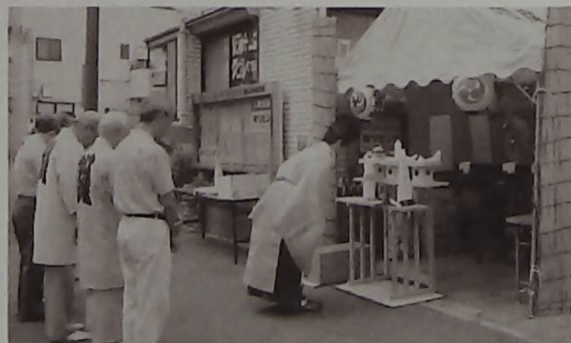
△祭りを始める前に広幡八幡宮の神主により神輿入魂式