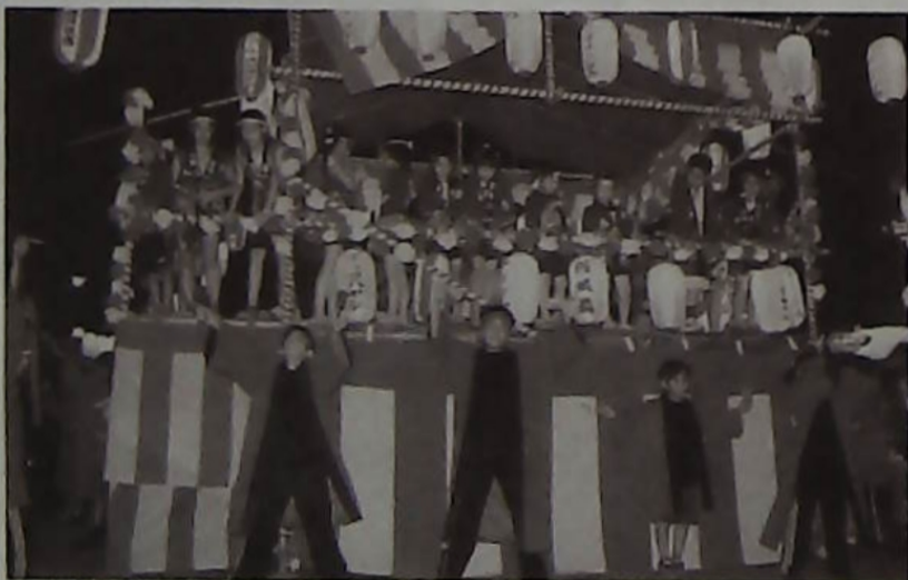
△子供が主役の松野台ハッピー夏祭り