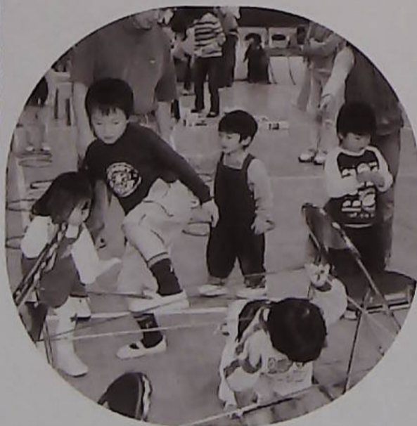
△おととつと、意外とむずかしいな