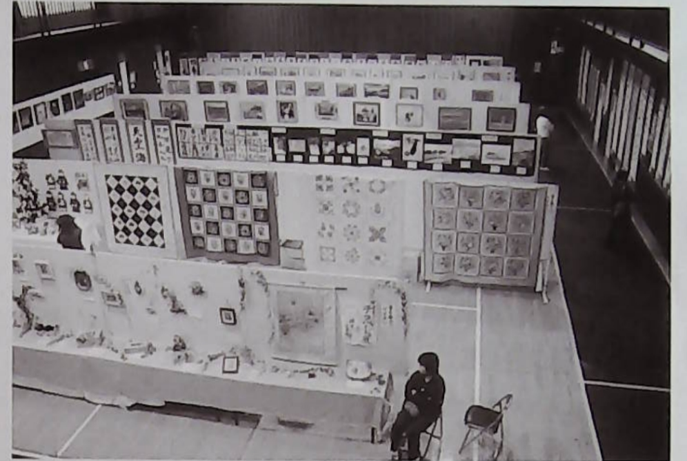
▽広い体育室も作品でいっぱい