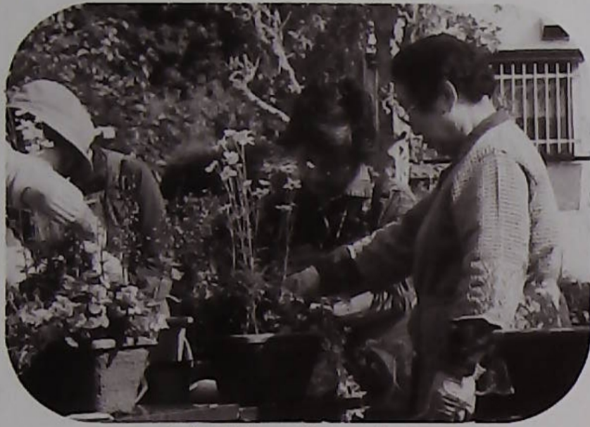
△寄せ植って楽しいわ!