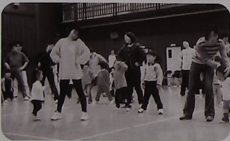
△まず準備体操で体をほくして