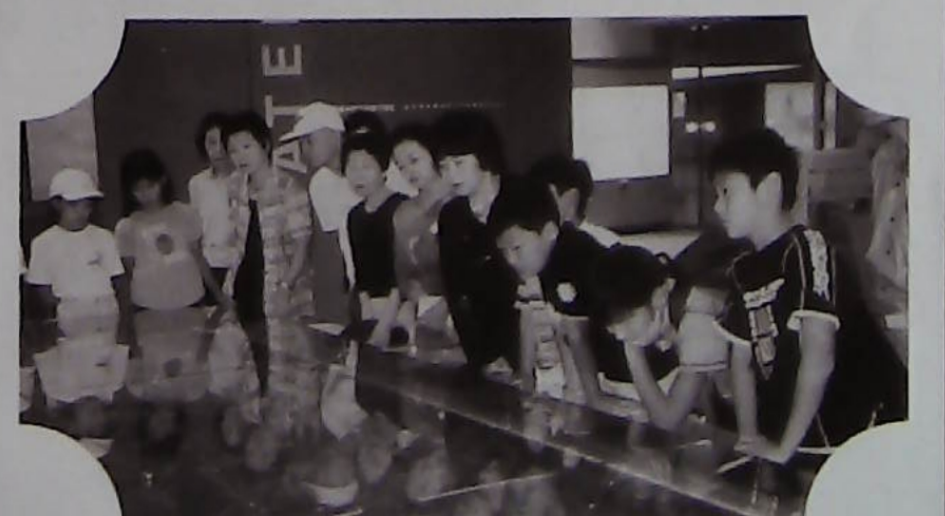
△湖沼汚染度全国ワーストワンを脱出でも、もっと手賀沼をきれいにならなければ