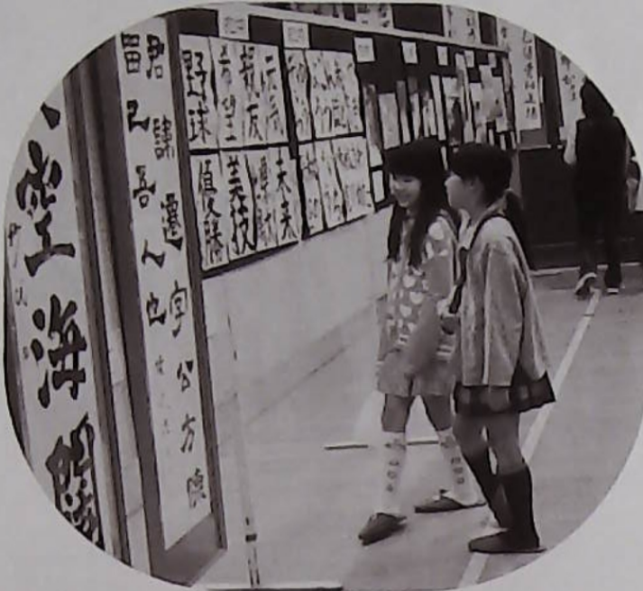
△ねえ、来年チャレンジしてみない