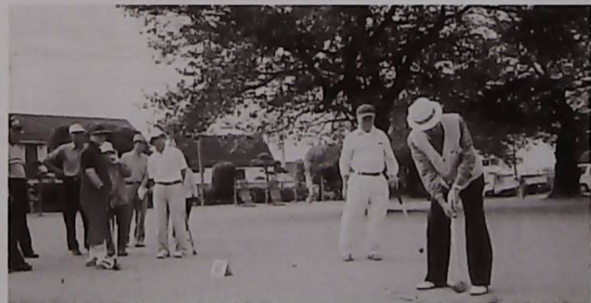
◁エイ、今度こそホールインワン!