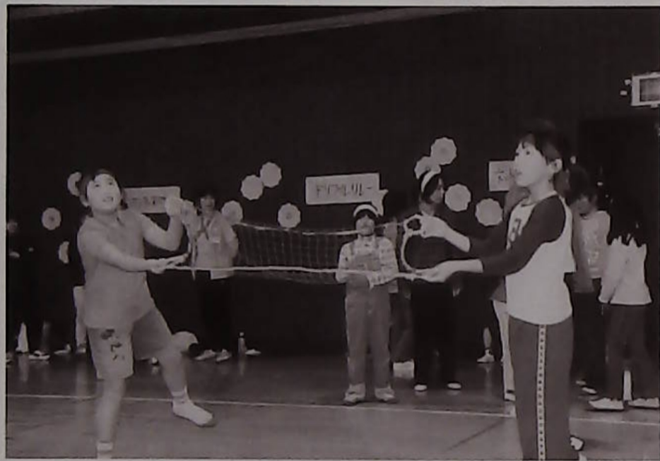
▷二人気を合わせて、ネットでキャッチ