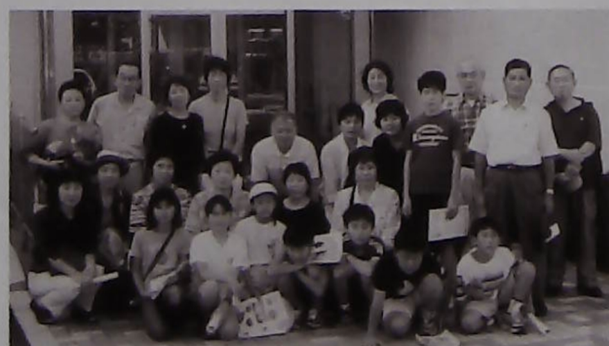
△さあ、船上見学に出発!