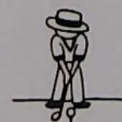
▷さあ、パーティをねらって