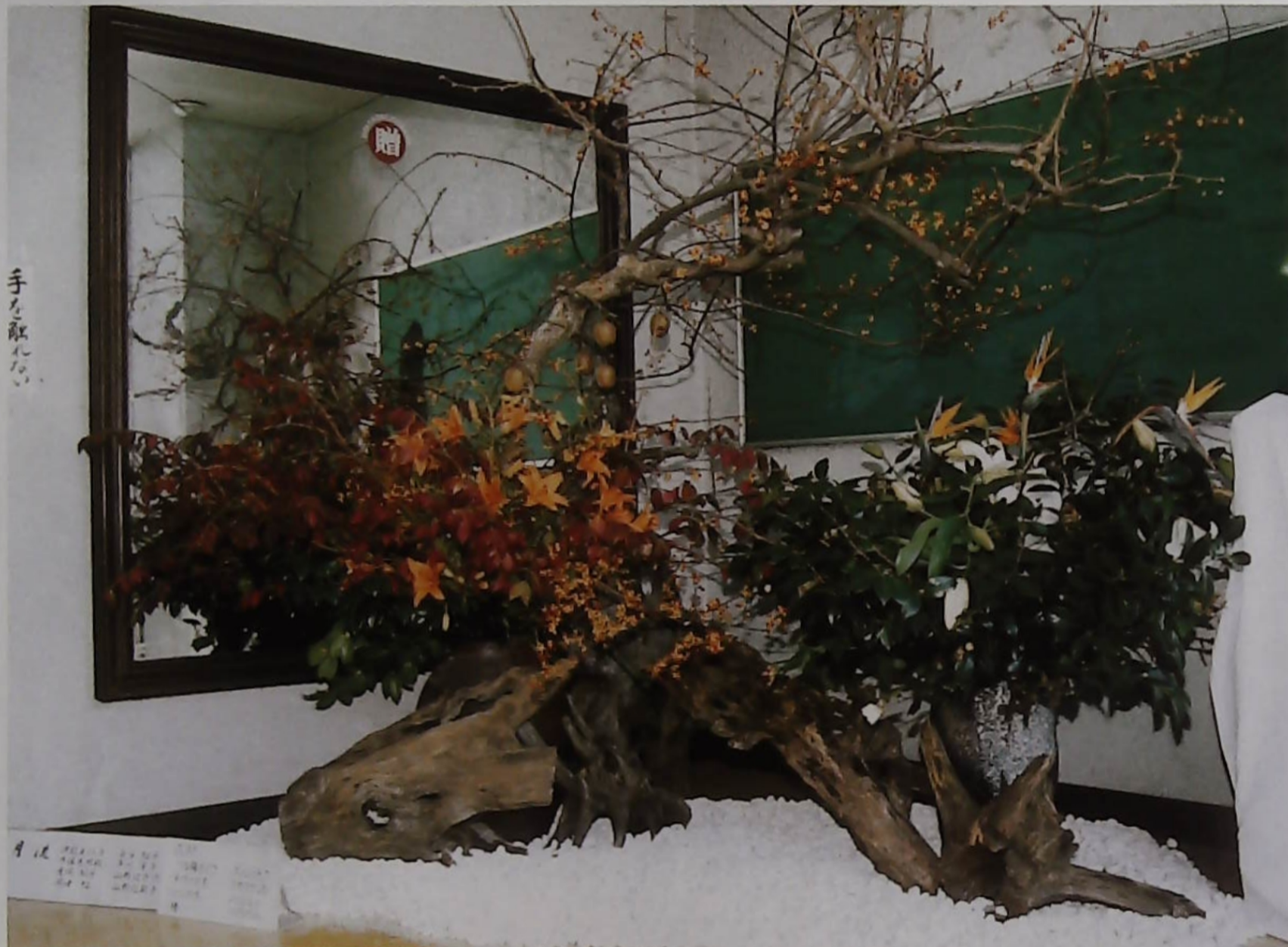
「生花」 J A東葛ふたば土支部婦人部華道クラブ (文化祭出展作品)