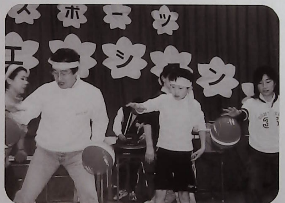
△日ごろの親子のコミュニケーションが生きるかな