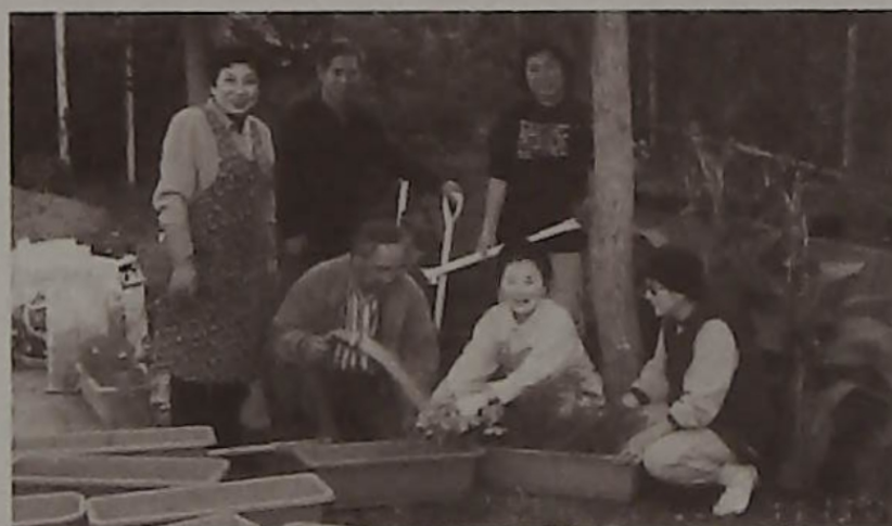
▲増尾ガーデニングの皆さんと共に (後中央)