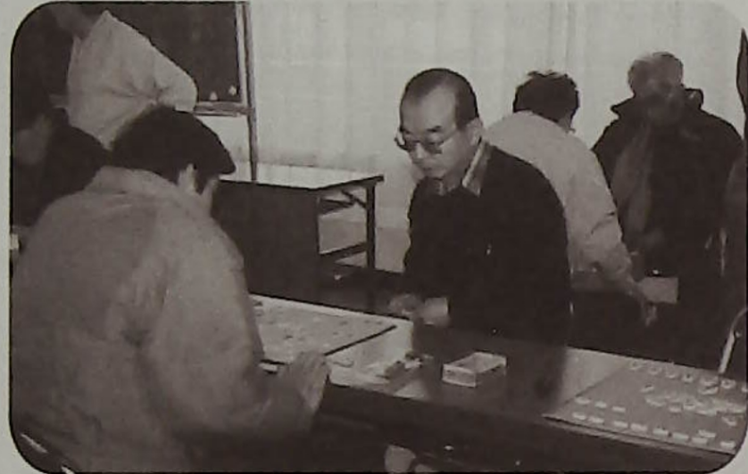
▲お隣は勝負がついたのかなあー！

例年通り有段者の参加が多く、緊迫した雰囲気で大大会を終えました。今後有段者は勿論、初心者の参加を期待したいものです。