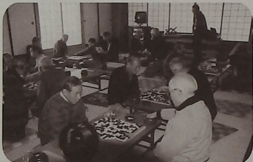
▲おじいちゃん頑張っ！子供たちにもブーム