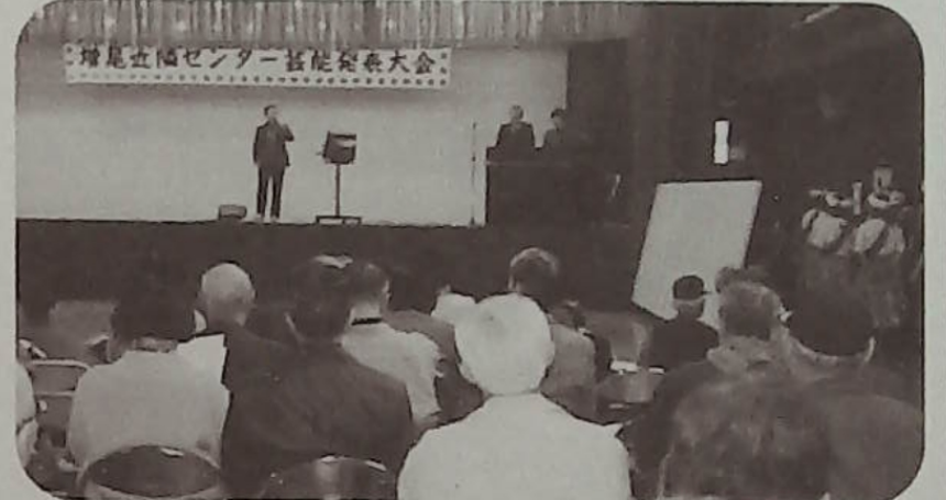
▲唄う人、踊る人、出番を待つ人！

春を身近に感じるなか、去る3月10日(日)当センター体育館に於て、恒例芸能発表大会が華やかに開催された。この大会も今年20回目という節目を迎え、これまで地域の人達に多くの関心をいただき、今では楽しみを倍増する、イベントとして根強く定着している。この日も世代を越えた心のふれあいを大切に、芸域の広い演技が披露され、例年を上回る盛況ぶりを見せていた。これからも地域福祉の一環として、幅広い企画を促進し潤いと実のある、芸能発表大会となるよう今後とも期待している。(福祉部)