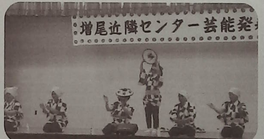
▲花笠音頭を踊る増尾町会のみなさん