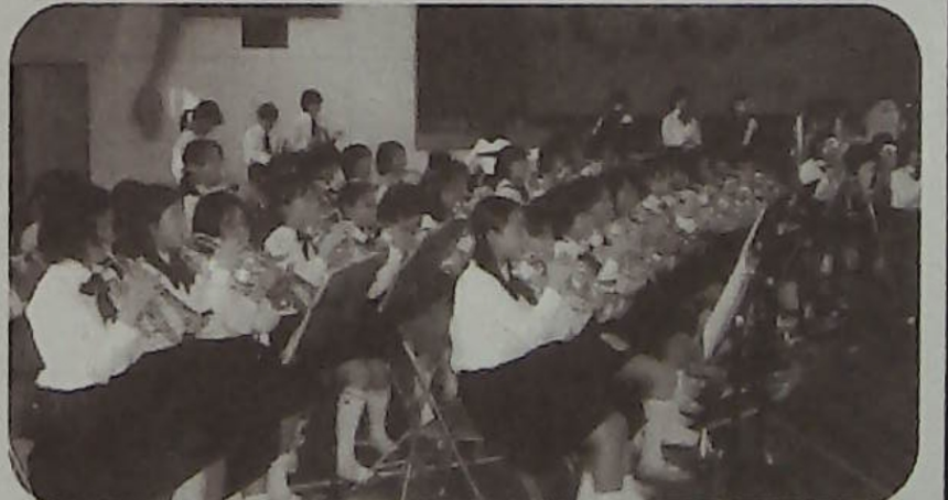
▲ジャズも吹いちゃう見事な演奏

3月2日土曜日、暖かな春の午後。増尾西小学校金管クラブの97名が心をつなげて6年生最後の記念コンサートが行われました。