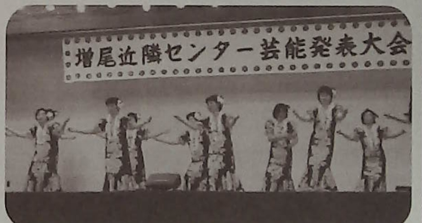
▲パリエル曲に合わせて増尾フラダンスのみなさん