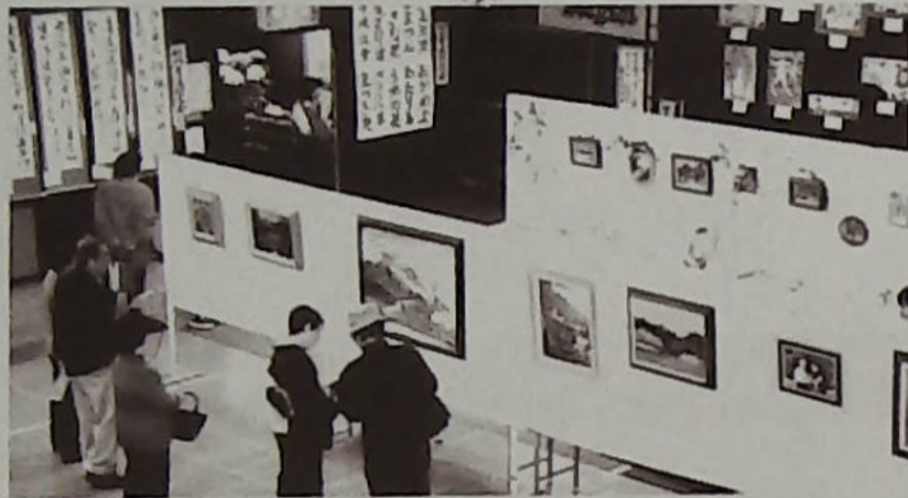
▲恒例の作品展も力作ぞろいで体育室も華やぐ