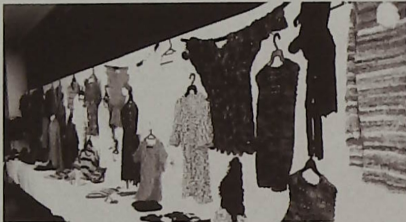
▲1目が大切な手編み作品は「時を編む」感あり