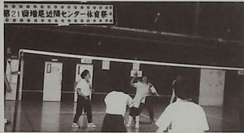
▲インディアカは素手で羽根をつく競技です

第21回体育祭は、運営協議会創立20周年記念事業の一環として第一部インディアカ大会、第二部シャトルゲームとボール送りゲームで町会・自治会対抗戦が行われました。インディアカは毎年アトラクションとして紹介を続けてきたゲームだけに、各チームとも互角の熱戦が繰り広げられました。優勝はAコートあざみ町会、Bコート増尾南ヶ丘自治会が勝ち取りました。第二部では例年通り親睦を深めることをモットーとしたゲームと福引きで和気あいあいと盛り上がり、総合一位は松野台自治会が射止めました。