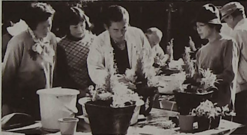
▲寄せ植えは中央を高くして——講習会は大盛況