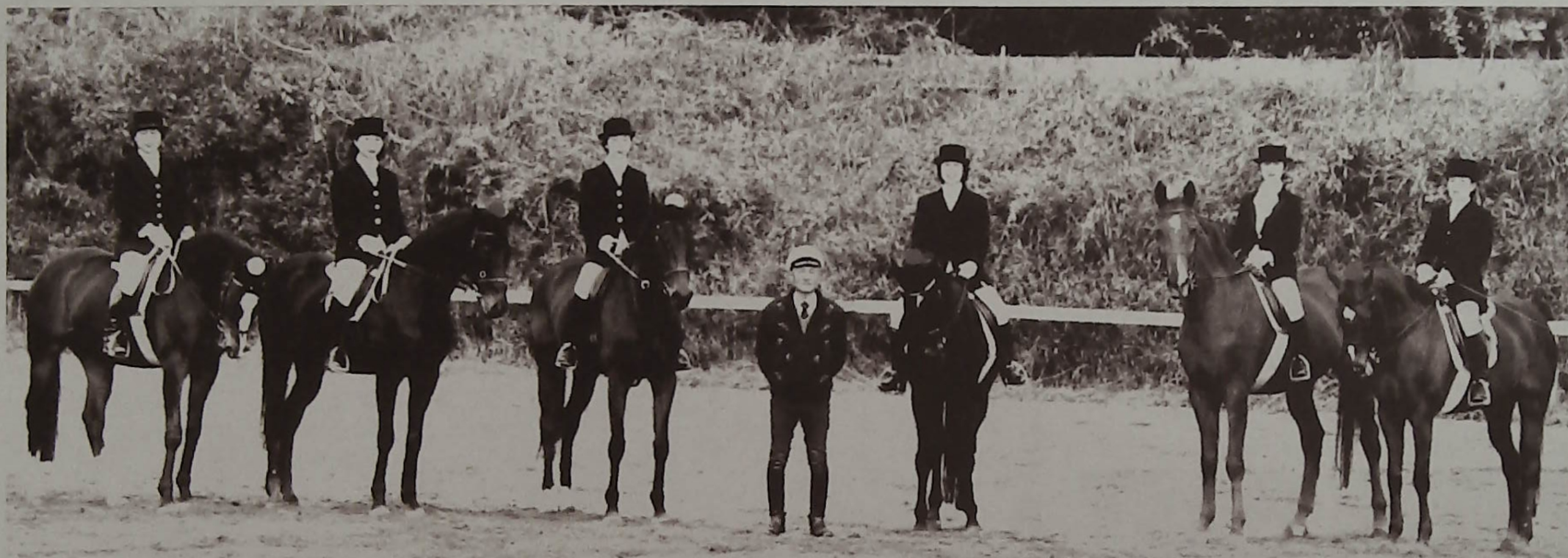
▲今年はうま年 中原中学校前「柏乗馬クラブ」のみなさん