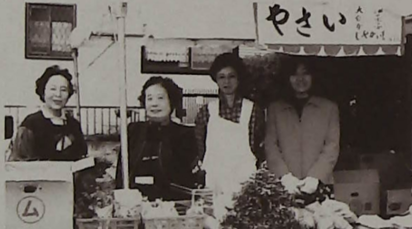
▲新鮮な野菜に大人気