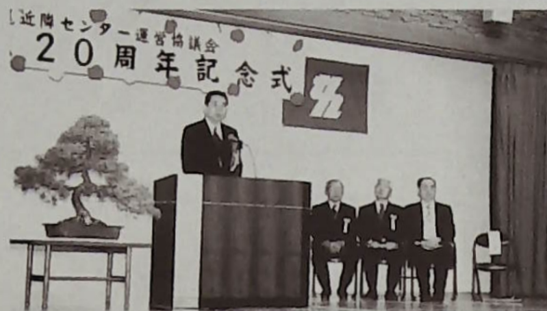
▲来賓に市長を迎えて