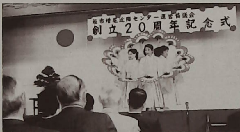
▲アトラクション 詩舞のみなさん