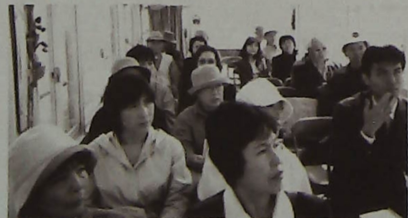
▲船上より手賀沼視察

ごみの分別はもちろん一人ひとりが注意し余分な作業は解消することを考えさせられた。 環境部