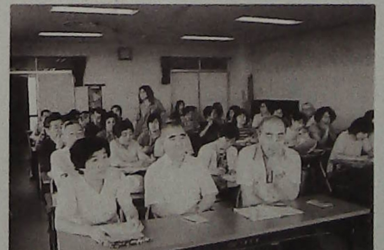
▲懇談会に参加した方々

利用者団体には文化系と体育系があり、皆さんの参加をお待ちしております。希望者はセンター窓口、登録団体の一覧表がありますので、お気軽にのぞいてみて下さい。