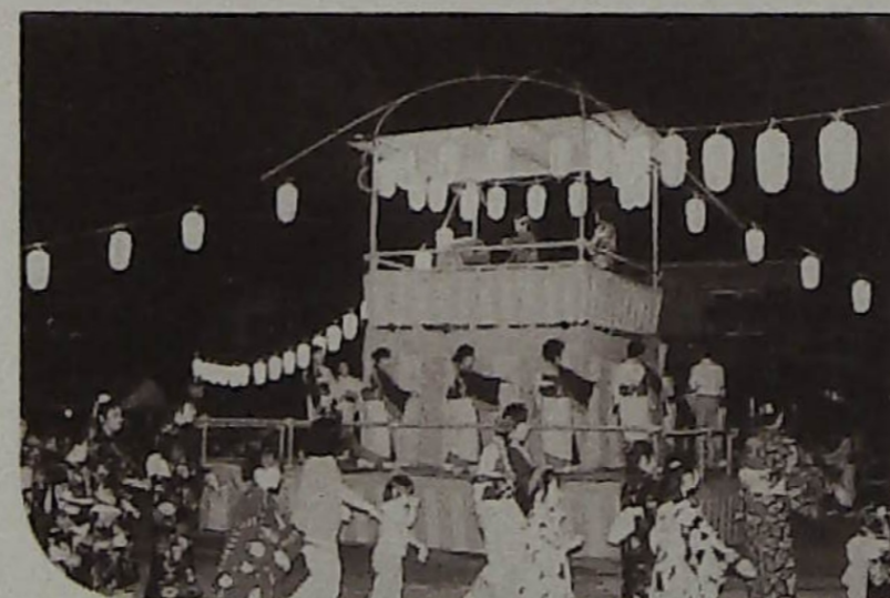
▲ゆかたを着て踊る子供たち