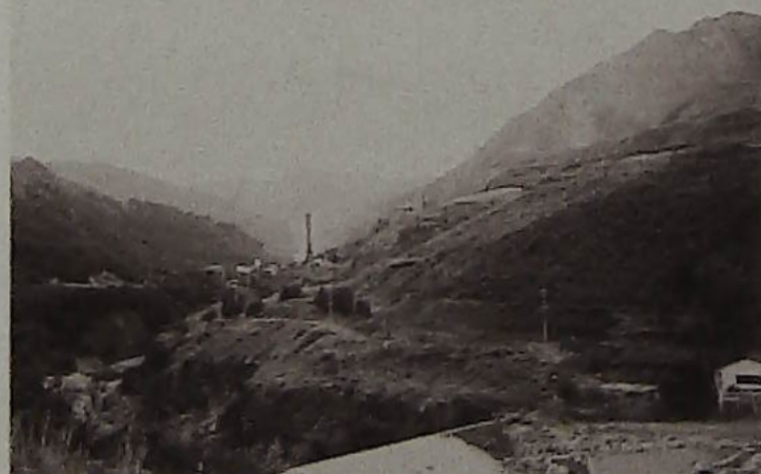
▲緑が回復しはじめた足尾銅山

本年度は、栃木県足尾銅山(我が国最初の公害発源地と言われている)及び足尾銅山鉱毒による被害民救済のため、銅山鉱業停止運動を開始し、議会で鉱毒事件につき、くり返し政府を追及しつつに衆議院議員を辞職して明治天皇に直訴した田中正造翁の生家隠居所、墓所(栃木県史跡)を見学、直訴状など多くの遺品に接し、翁の情熱と偉大さに感動を覚えた研修でした。