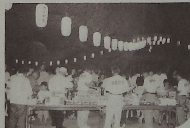
▲参加賞配りの役員さん