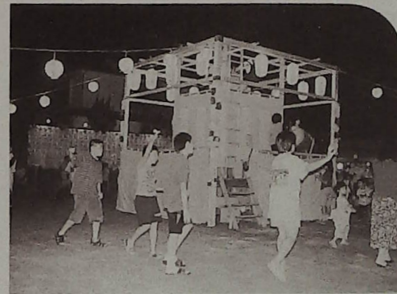
▲Tシャツ姿の似合う盆踊り