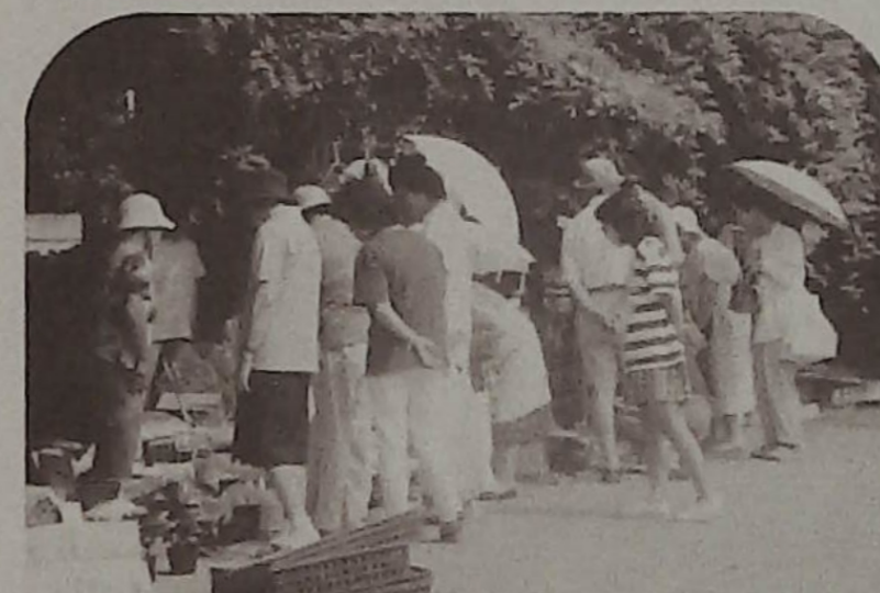
▲フリーマーケットも大賑い