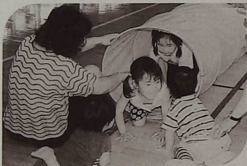
▲トンネルくぐって楽しそう

アンケートでは全て好印象の回答を戴き、今後も幼児対象の企画の充実に励みます。週末に企画しますので、是非おとうさんも一緒に遊びましょう。