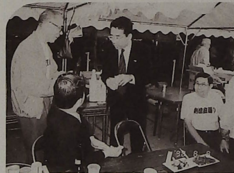
▲市長さんもふれあい参加