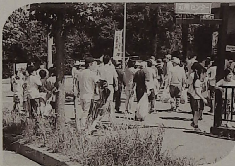
▲ゴミゼロ運動の参加者

去る5月31日(日)、午前8時30分～10時まで、題記ごみ0運動を行いました。当協議会でも多数の方々のご協力、参加を得まして題記目的に多少でも近づいたものと思います。ご協力ありがとうございました。