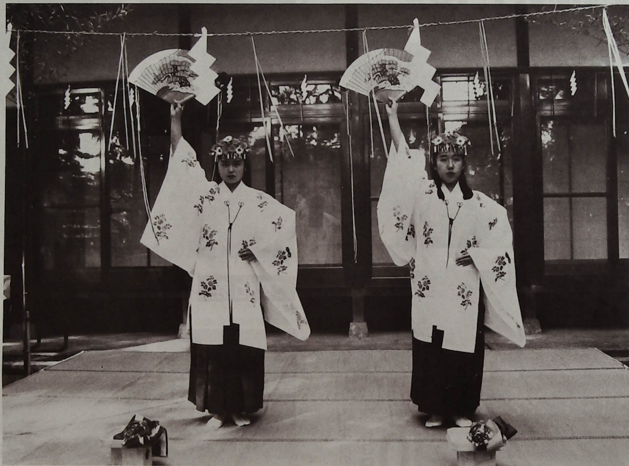
廣幡八幡宮 浦安の舞

平成7年1月 No.32 ●編集・発行 柏市増尾近隣センター運営協議会・広報部 増尾近隣センター 〒277 柏市増尾1614番 ☎(74)7211 吉田 稔 兼