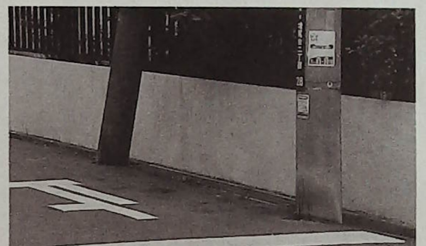
市がゴミを回収したあとは立看板もなくきれいな道路にもどって…