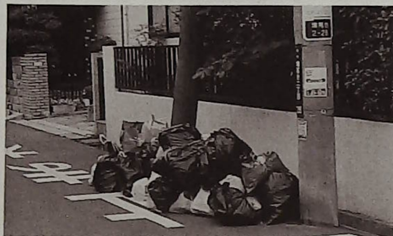
立看板は撤去されても指定された場所にゴミは集積されるが…