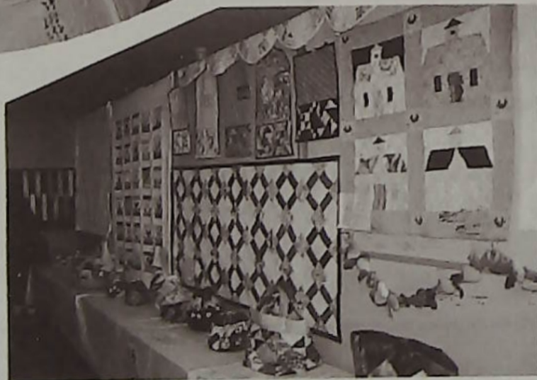
▲パッチワークの作品群