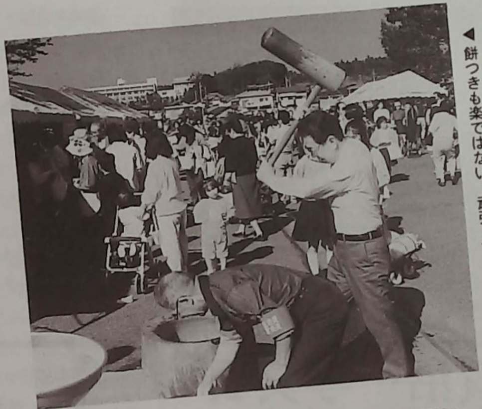
▲餅つきも楽ではない、頑張ってもうひとつき