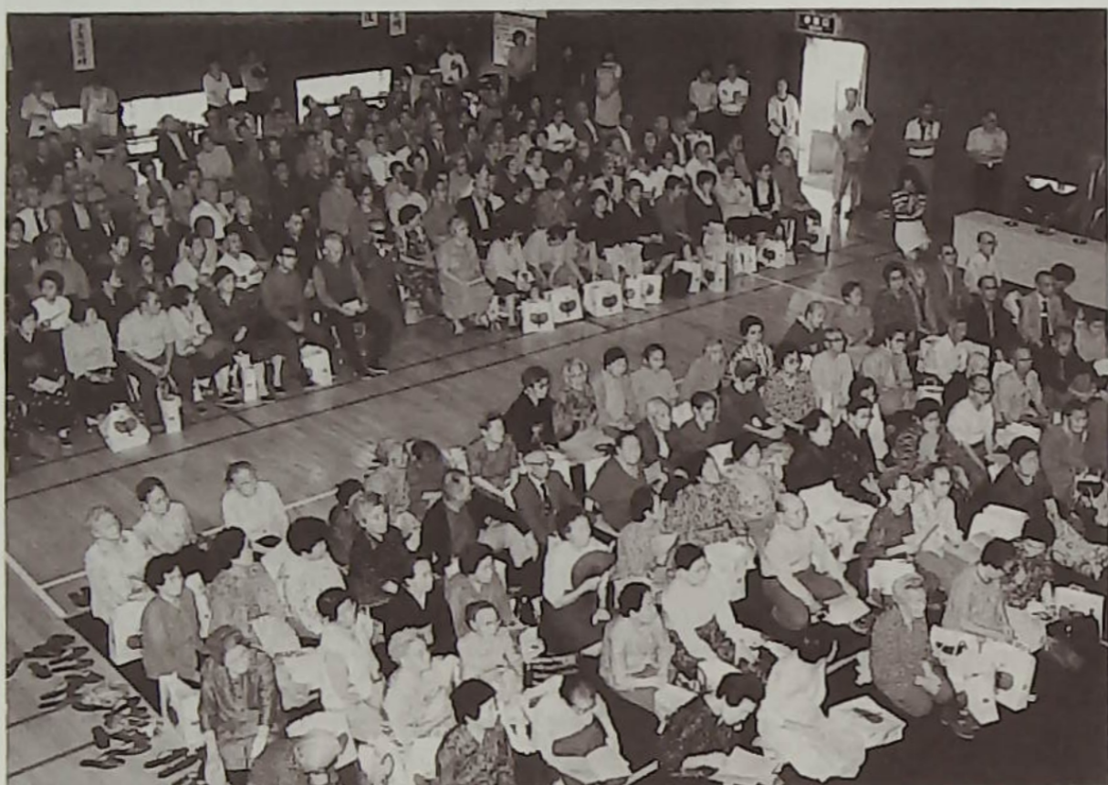
▲敬老の日、今日を楽しく、いつまでもお元気で