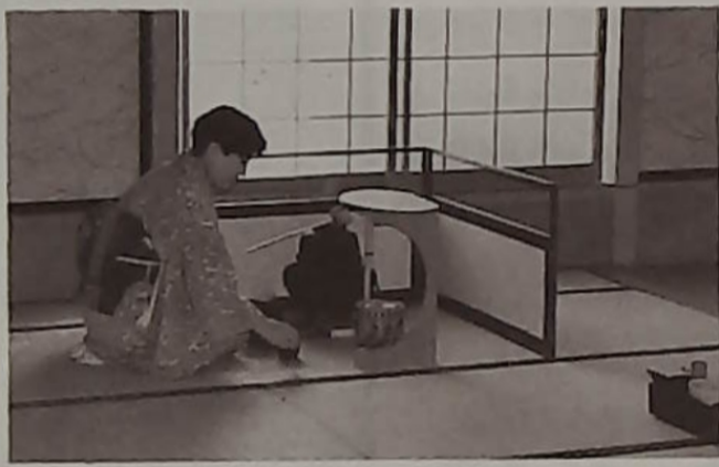
▲茶道のお手なみ拝見