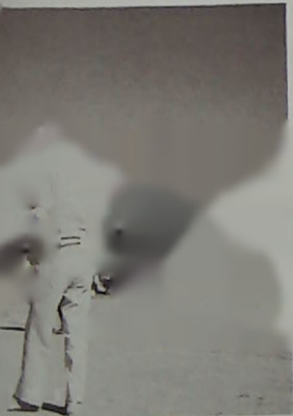
もったゲーム展開