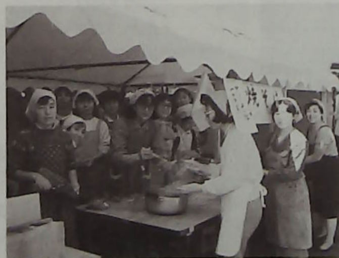
▲焼そばコーナーは大賑わい、良く売れます