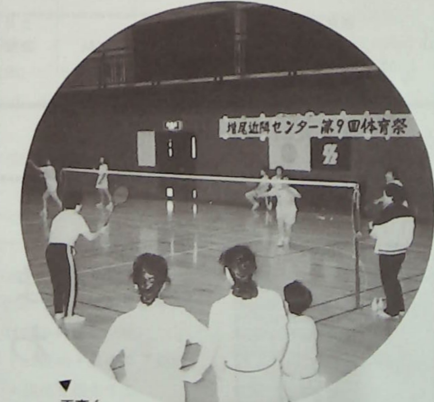
▼天高く、バドミントン息を抜きながらの妙技ご披露