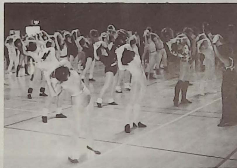
▲若さいっぱいの肢体、心も軽くの美体チーム