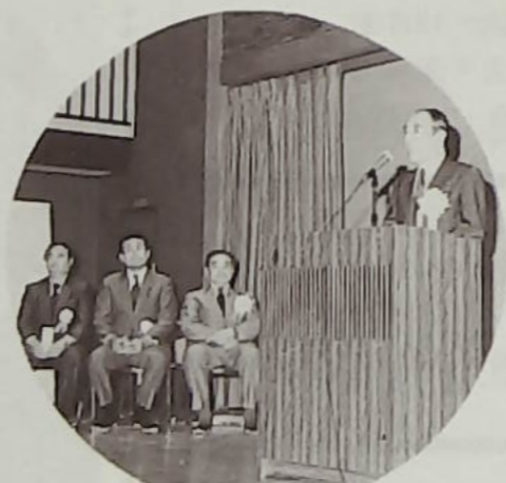
▲柏市長代理、長山助役のご祝詞