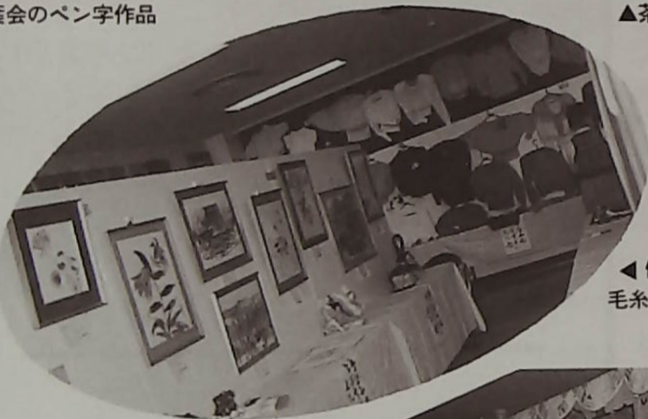
▲優雅な絵画と毛糸編みの作品コーナー