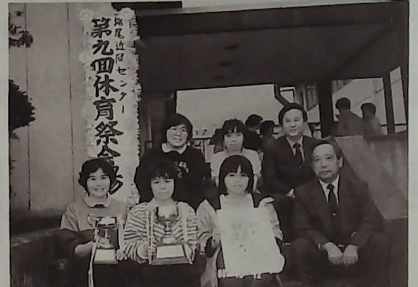
▲卓球部、優勝者の皆さん