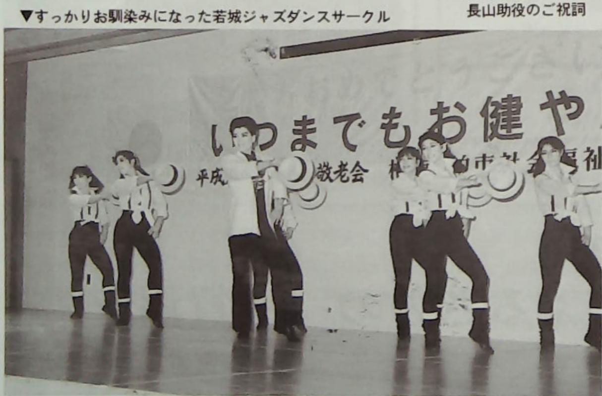
▼すっかりお馴染みになった若城ジャズダンスサークル