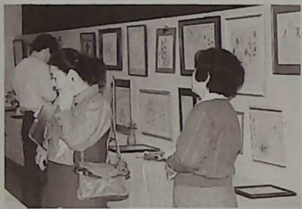
▲水葉会のペン字作品