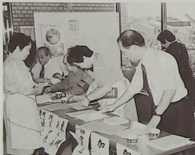
▲民生委員の皆さん、受付ご苦労様です