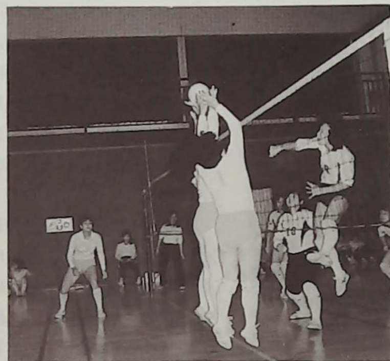
▲パワー全開、それゆけママさんバレー