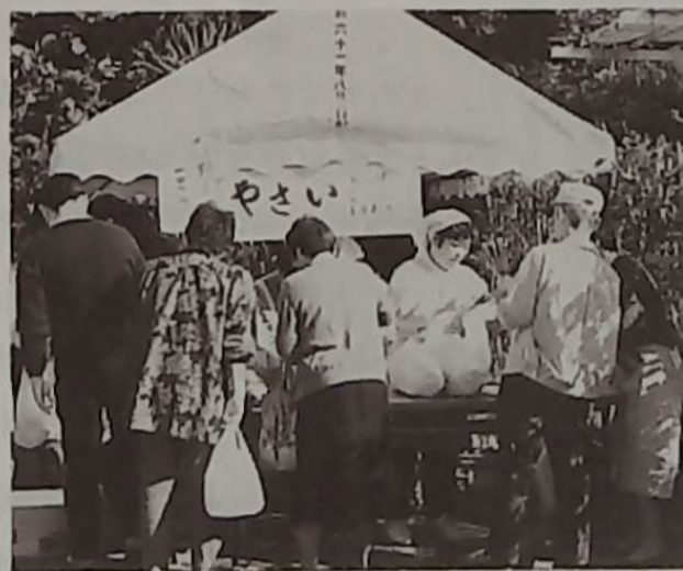
▲やさいコーナーはお、忙がし、新鮮で安くて