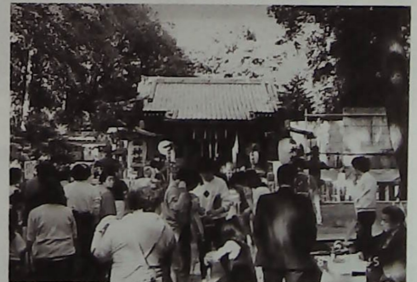
▲本年初公開、神殿前のカラオケ大会

広幡八幡宮は、第59代宇田天皇勅願所として鎮座されたと伝えられ、その後、鎌倉時代の建久4年、柏市近郷の総鎮守として社殿が再建された。3代将軍徳川家光公からは、御朱印地10石が献上されました。御祭神は、菅田別命(第15代応神天皇)で、他に4柱の御祭神が合祀されています。現在の御本殿は、天保年間造営のものと伝えられ権現流れ造り、基礎の石垣は、安土桃山時代の形成を遺す貴重なものです。約6千坪の境内には「宮根遺跡」があります。毎年10月15日が大祭日に当り、五穀豊穰と国の安寧が祈願されます。特に昨年は、氏子・町会員の親睦を深め、より氏神様に親しんで貰おうと、境内において、パザー・芸能大会が催され、普段の静寂な神域もたくさんの親子連れで終日賑わいました。