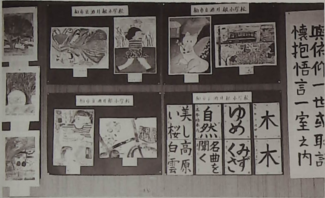
小学児童の絵画、書道作品展