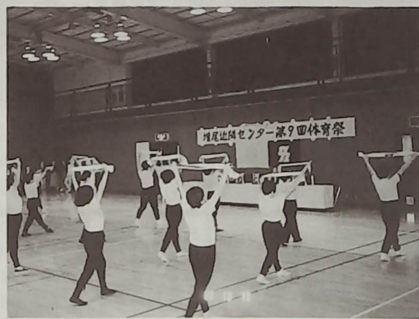
▲美しくなる華麗な健康体操をどうぞ