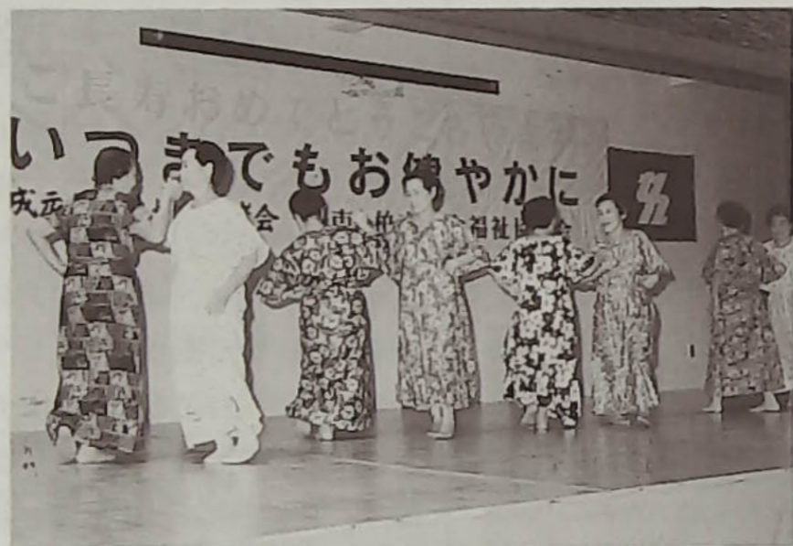
▲衣裳もよし、踊りも抜群