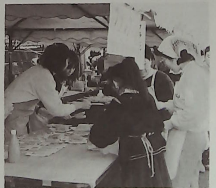
▲いらっしゃい、フランクフルトはいかが