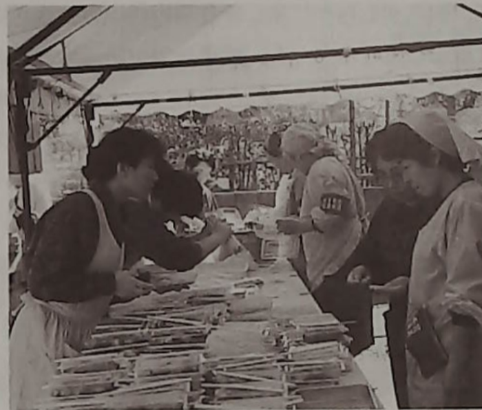
▲餅つきの音もよし、売れゆきもよし