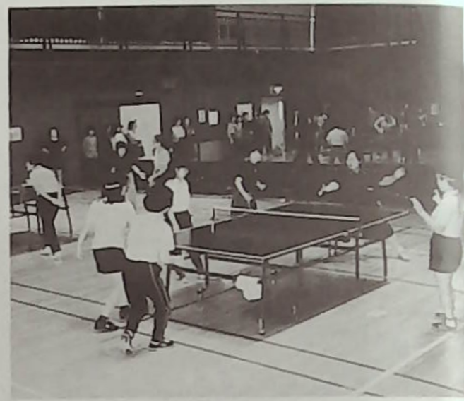
▲出た！得意なスマッシュ、気合充分の卓球部員たち