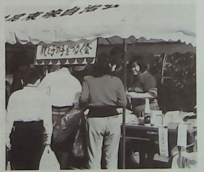
▲近くの施設からバザーに参加