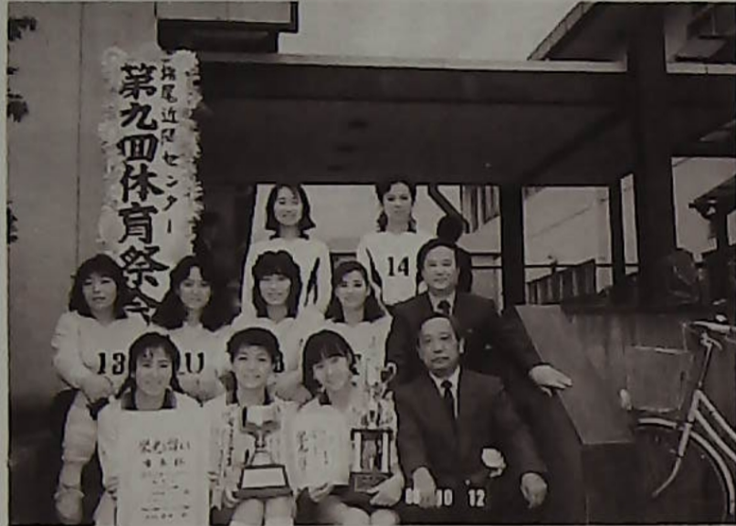
▲バレーボール優勝、酒井根クラブ