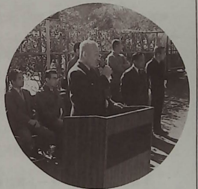
▲有馬土地区代表地区長のふれあいの集いの挨拶