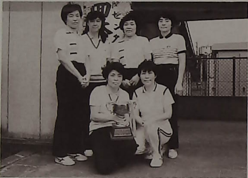
▲バドミントン優勝、Dチーム

去る10月12日、当近隣センター体育館で恒例の体育祭が開かれ、各部門別に競技が行なわれた。各チームの猛練習の成果が発揮され、好ゲームが多く見られ大変楽しいムードの内に本大会も無事終了した訳です。選手の皆さん、そして大会関係者の皆さん、ほんとうにご苦労さまでした。