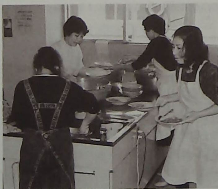
▲カレー作りでお忙しい裏方さん、ご苦労様です