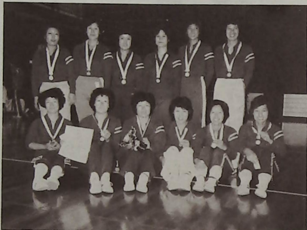
金メダルを胸に喜ぶバレーの柏酒井根チーム