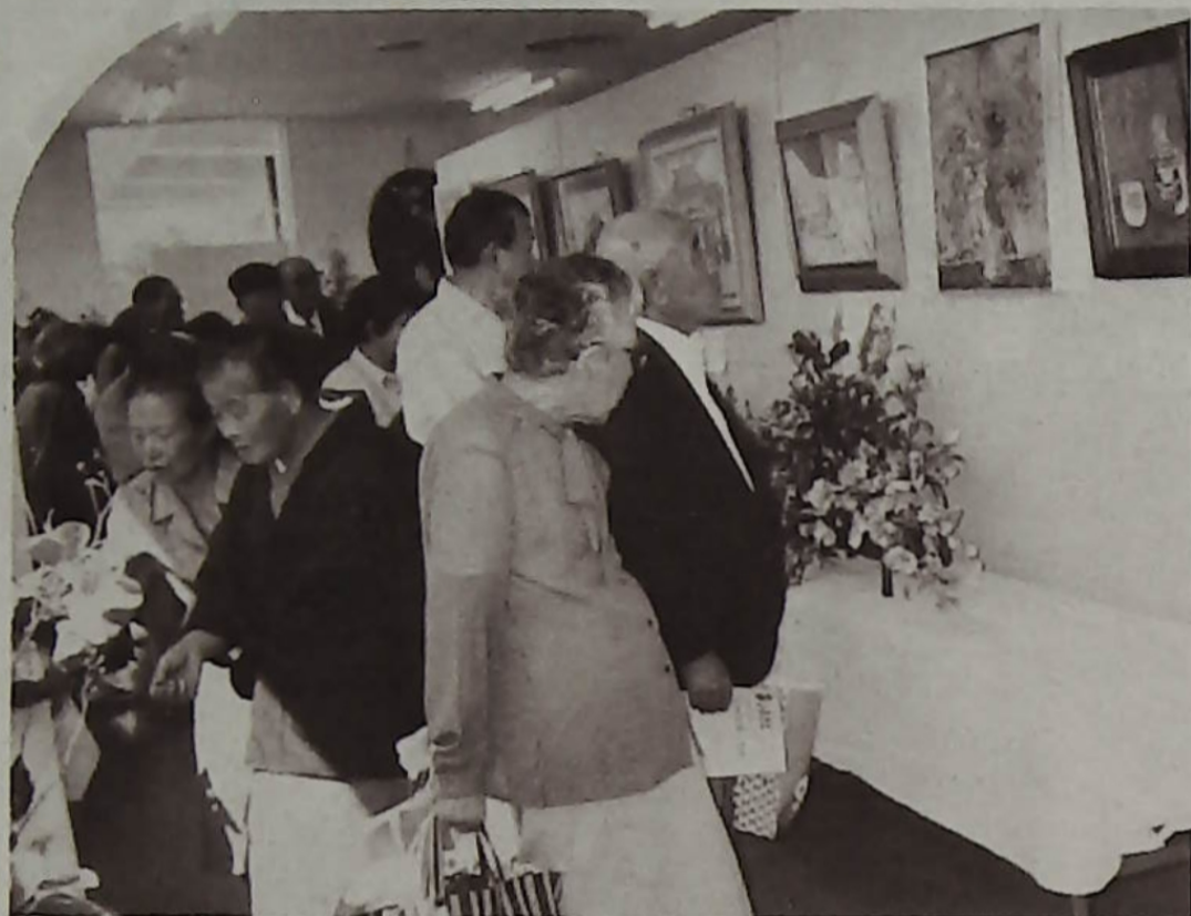
展示のすばらしい作品に見入る人々