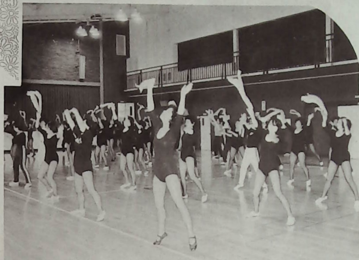
美体の成果？ 見事な脚線美