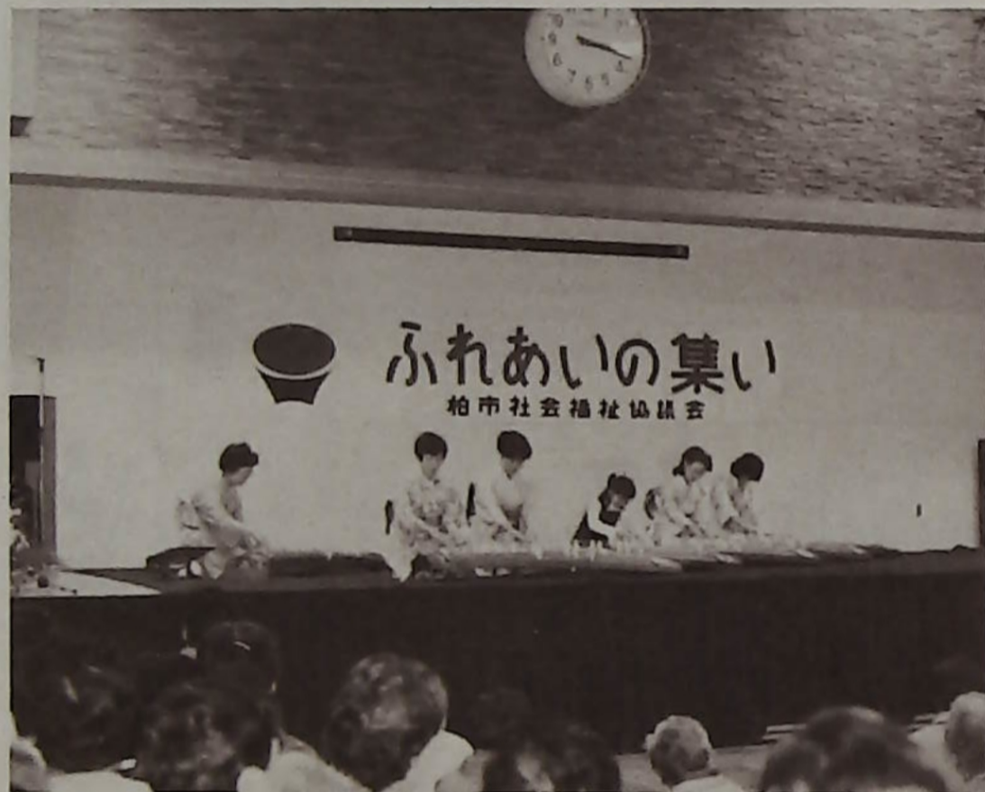
ふれあいの集いで琴の音色に聞き入る人々