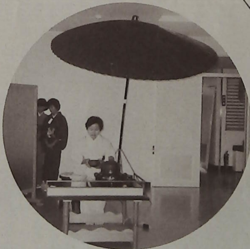
敬老会でお年寄りに抹茶の接待