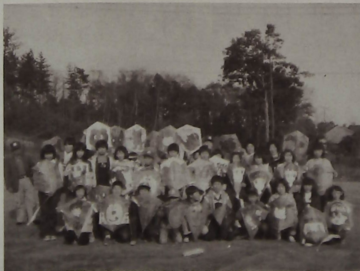
作品のタコを胸に喜ぶよ子たち