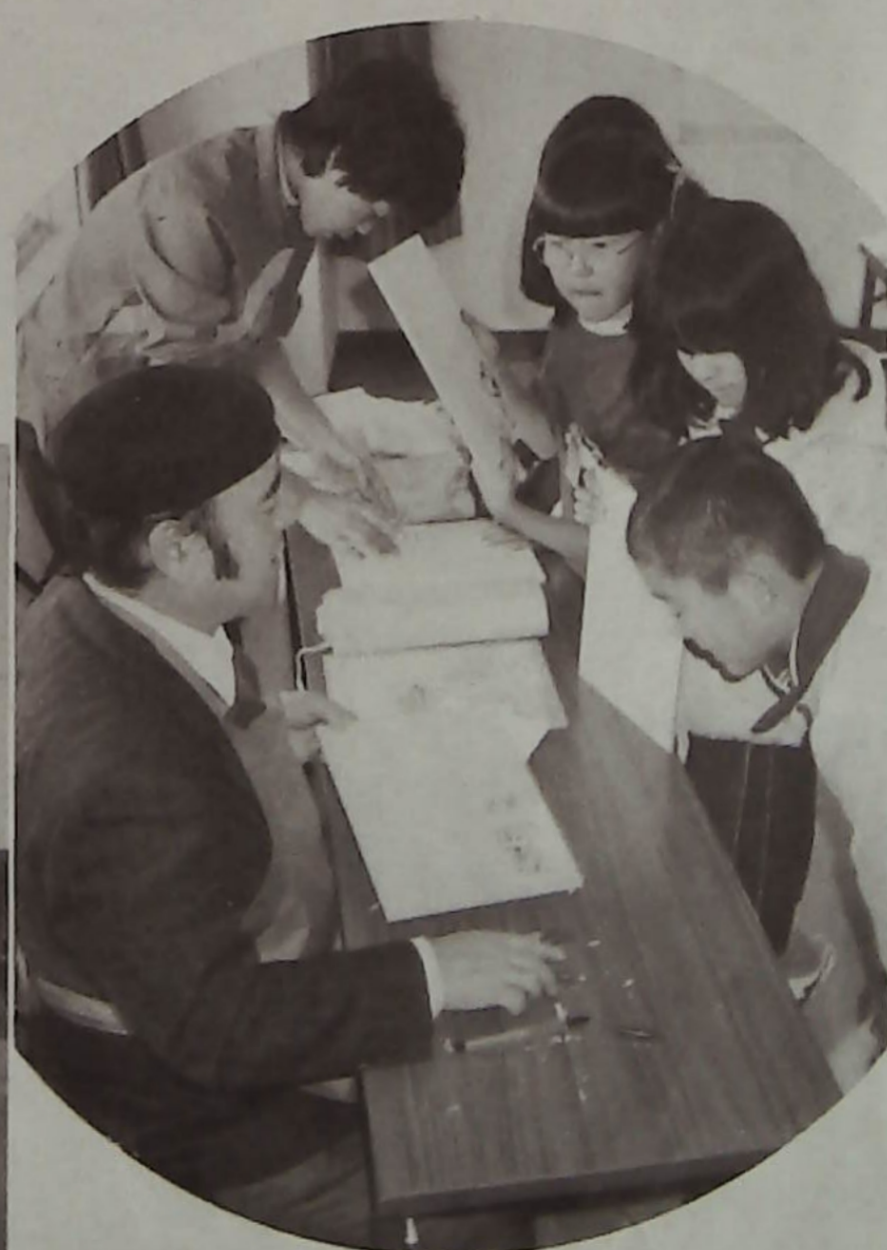
年賀状はこの版画にしよう