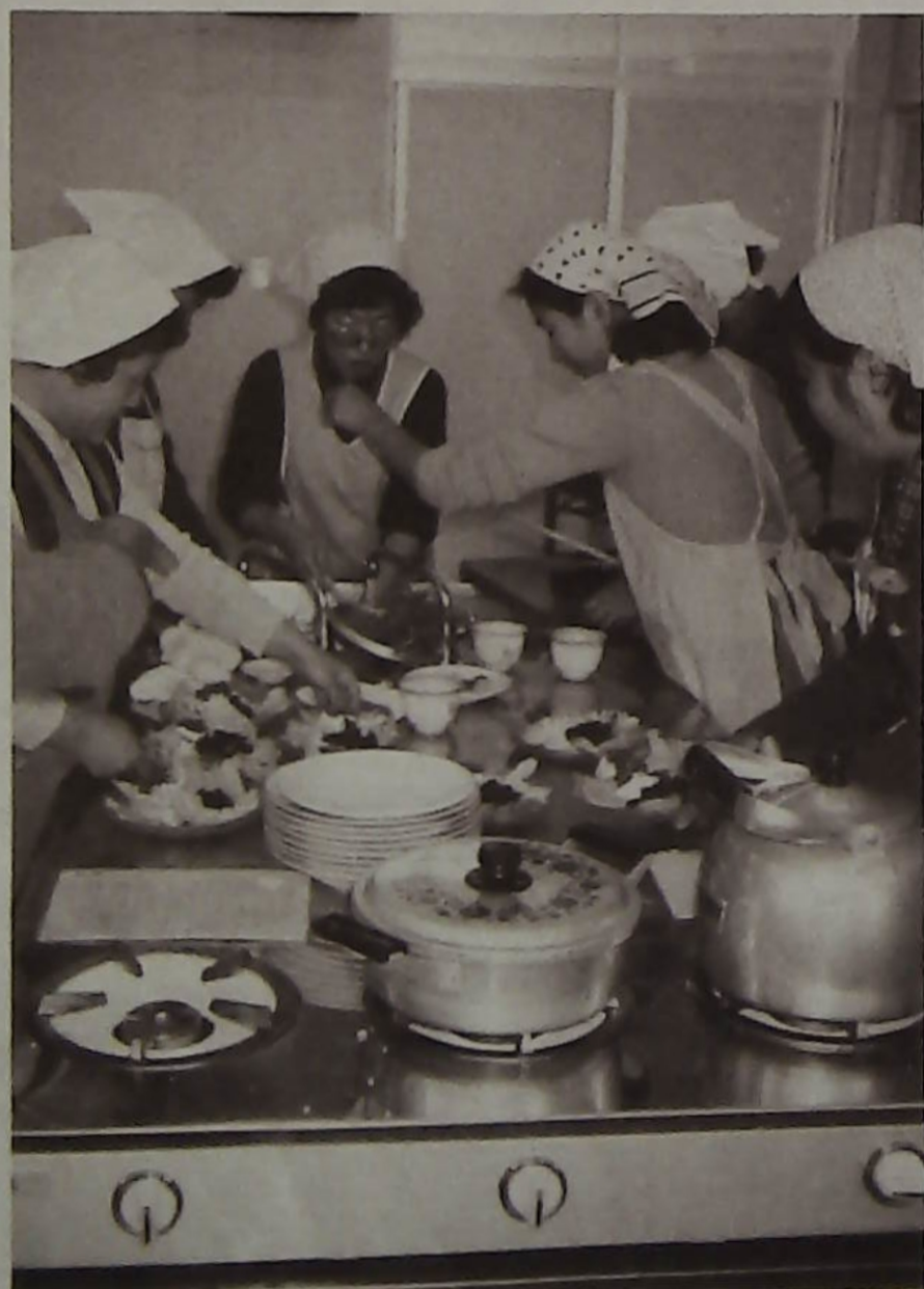
和気あいの料理教室