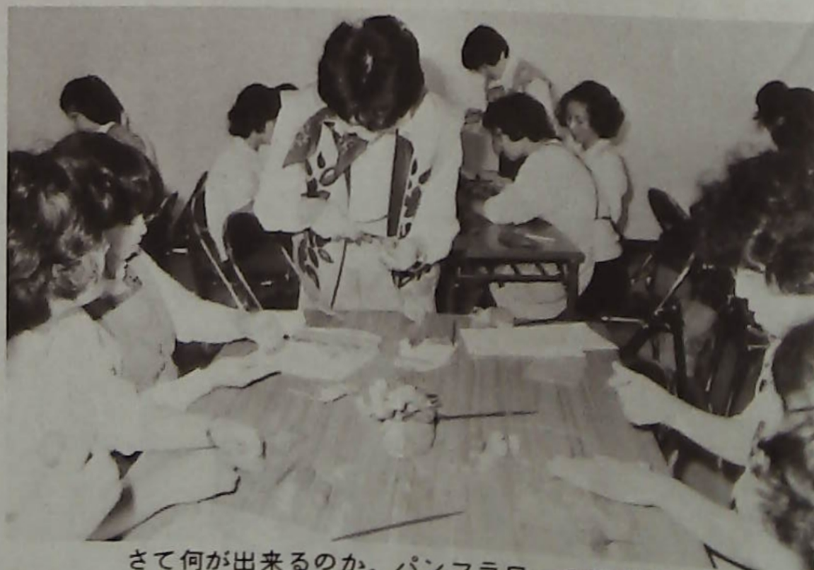
さて何が出来るのか、パンフラワーの講習会