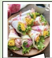
花束のようなサンドイッチ (デザインが変わる場合もあります)